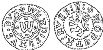
Ryc. 3. Kwartnik ruski Władysława Opolczyka (1372—1378) (E. Kopicki: Monety ziemi ruskiej... , s. 172)