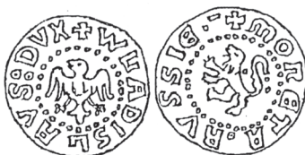
Ryc. 4. Kwartnik ruski Władysława Opolczyka (1386—1387) (E. Kopicki: Monety ziemi ruskiej... , s. 172)