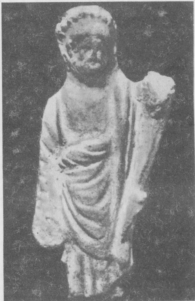
1. Statuetka terakotowa z Odessos przedstawiająca Wielkiego boga. M.Mirczew, Sbirkata ot terakoti w muzeja na gr. Warna, Izwestija na Archeologičeskoto družestwo gr. Warna, X 1956, s.29, tabl.VIII, ryc.33

wania zmarłych charakterystyczny na tym terenie i w tym czasie tylko dla ludności miejscowej trackiej - oraz znalezione w nich przedmioty wyposażenia świadczą o tym, że w okresach klasycznym i hellenistycznym Trakowie zachowali swoje dawne zwyczaje pogrzebowe. Podobnie było w okresie rzymskim, z tych czasów bowiem pochodzi kilka grobowców kurhanowych odkrytych na terenie