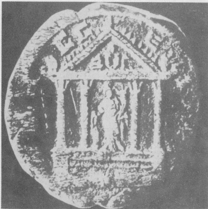
5. Moneta Gordiana III z Odessos z przedstawieniem fasady świątyni Wielkiego boga - Darzalosa. Archeologiczeski muzej, Warna, Sofia 1965, ryc.34

konkretną, istniejącą w rzeczywistości w Odessos świątynię Wielkiego boga - Darzalosa.