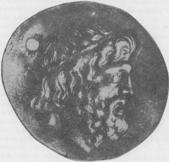
2. Srebrna tetradrachma (awers) z Odessos z przedstawieniem głowy Wielkiego boga. I.Wenedikow i T.Gerasimow, Trakijskoto izkustwo, Sofia 1973, ryo.64

wstążką. Niektórzy badacze przypuszczają, że wieniec blusozowy świadczy o synkretyzmie bóstwa z Dionizosem, a wieniec z wici winogronowych o synkretyzmie z Plutonom 13 . Na podstawie pewnych zbieżności występujących w sposobie przedstawiania i w atrybutach Wielkiego boga i Plutona wysuwane są przypuszczenia, że pod niewiele mówiącym określeniem Wielki bóg, którym raczej ogólnie określano bóstwa o charakterze chtonicznym, kryje się Pluton 14 . Ze srebrnych tetradrachm bitych w Odessos w okresie hellenistycznym na szczególną uwagę zasługuje emisja monet z drugiej połowy II wieku p.n.e., która ze względu na swoje walory artystyczne należy do szczytowych osiągnięć sztuki menniczej nie tylko Odessos, ale także pozostałych miast greckich leżących na zachodnich wybrzeżach Morza Czarnego (ryo.2 i 3). Na awersie mo-