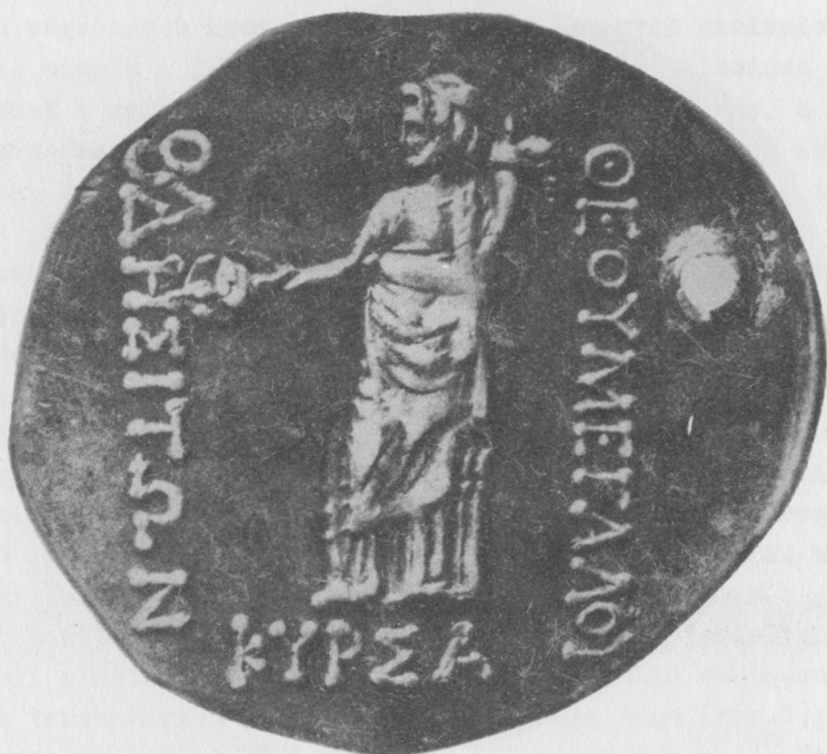
3. Srebrna tetradrachma (rewers) z Odessos z przedstawieniem posągu kultowego Wielkiego boga. I.Wenedikow i T.Gerasimow, Trakijskoto izkustwo, Sofia 1973, ryo.65

net widzimy przedstawienie głowy Wielkiego boga w prawym profilu, a na rewersie wyobrażenie całej postaci z paterą w prawej ręce i rogiem obfitości w lewej. Postać jest obramowana napisem ΘΕΟΥ ΜΕΓΑΛΟΥ ΟΔΕΣΣΙΤΩΝ. Napisanie tych słów w genetiwie wskazuje na to, że napis odnosi się do wyobrażonej postaci, a zatem moneta jest poświęcona temu właśnie bóstwu. Wszystko wskazuje na to, że monety zostały wybite z okazji uroczystości, najprawdopodobniej igrzysk publicznych ku czci Wielkiego boga 15 . Wszystkie te okoliczności wyraźnie świadczą o wzrastającej roli kultu Wielkiego boga w Odessos od wczesnego okresu hellenistycznego. Niektórzy badacze przypuszczają, że już w IV wieku p.n.e. Apollon - główne