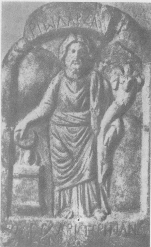
4. Relief wotywny z Targowiszte przedstawiający Wielkiego boga - Darzalosa. G.Mihailov, Inscriptiones graecae in Bulgaria repertae , II, Sofia 1958, ryc.768

stawienie głowy Wielkiego boga widzimy na monetach bitych w Tomis 24 . Statua bóstwa jest przedstawiona na monetach bitych w Dionizopolis za panowania Karakalli, Aleksandra Sewera i Gordiana III 25 . Z okręgu Targowiszte pochodzi płytką wotywna z reliefem przedstawiającym Wielkiego boga (ryc.4) 26 . Inne płytki