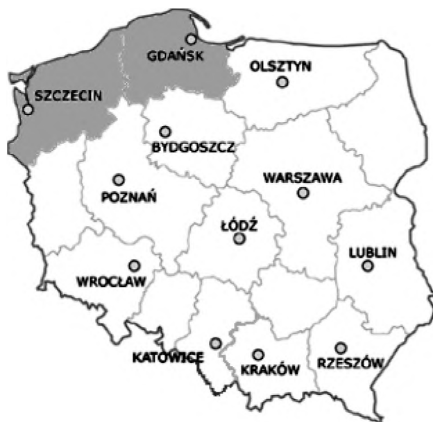
Rys. 1. Region pomorski, w którym prowadzono badania.

Przeprowadzono również jedno spotkanie edukacyjne społeczności lokalnych w Ośrodku Edukacji Ekologicznej w Lipiu – gmina Rąbino, w którym wzięli udział przedstawiciele Związku Gmin Doliny Parsęty, okoliczni mieszkańcy i młodzież szkolna. Oprócz badań ankietowych opracowano na podstawie informacji ze stron internetowych, charakterystykę wybranych gmin w celu oceny ich lokalnej działalności edukacyjnej.