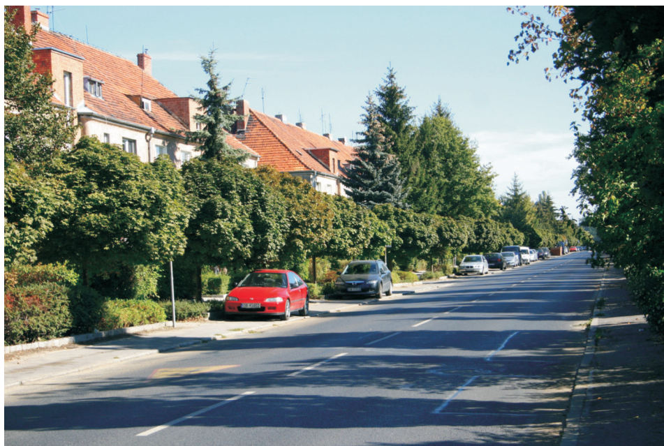
Fot. 3. Wrocław, ul. Dembowskiego – mocna granica zespołów kompozycyjnych osiedli Sępolno i Biskupin (fot. R. Maga-Jagielnicka, 2012)

w zakresie stanu technicznego i estetycznego przestrzeni publicznych – przez mieszkańców Wrocławia. Cechy kompozycyjne całego założenia urbanistycznego przyczyniły się do wytworzenia silnych więzi społecznych w obrębie osiedla i niezmiennie pozytywnych opinii w skali całego miasta 10 . Wyraźne, bardzo proste i czytelne w odbiorze ograniczenie tego dużego, 100-hektarowego terenu od sąsiedniego osiedla Biskupina wzdłuż ul. Dembowskiego stanowi przykład mocnej granicy. Po przeprowadzeniu prac renowacyjnych ulica, jako element graniczny, prezentuje wysoki standard (fot. 3.): wyremontowane długie elewacje charakterystycznej dla Sępolna niskiej zabudowy mieszkaniowej z przedogródkami, dostosowana do skali założenia zieleń przyuliczna (klony kuliste) i aleja pieszo-rowerowa, obsadzona potrójnym szpalerem drzew (dęby odmiany kolumnowej). Diagnoza stanu kompozycji z 1996 roku wykazała unikalną w obszarze miasta, pozytywnie ocenioną charakterystykę osiedla Sępolno jako zespołu o wyraźnie wykształconych cechach. Współczesny stan techniczny i estetyczny na terenie osiedla jest wysoce niezadowolający, ale nawet tak skromne działania, jak opisana kompleksowa rewaloryzacja fragmentu przestrzeni publicznej wzdłuż jednej z ulic, świadczy o docenieniu rangi tej ulicy jako ważnego elementu granicznego.