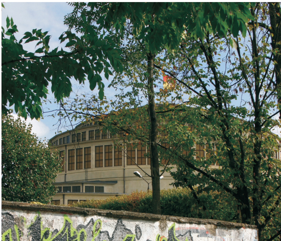
Fot. 2. Wrocław, zespół Hali Stulecia – nieodpowiadająca prestiżowi miejsca granica od strony ul. Wróblewskiego

analizy spełniło w najwyższym stopniu. O wysokiej ocenie całego zespołu zdecydowały w dużym stopniu granice, które bardzo mocno wydzielały teren osiedla z otoczenia. Najwyraźniejsze granice zespołu występują od strony północnej, zachodniej i południowej, ponieważ utworzone są przez kilka elementów: długie odcinki ciągłej linii zabudowy, równoległe usytuowane ulice, chodniki, ogrodzenia (często występujące w formie strzyżonych żywopłotów), towarzyszące zabudowie szpalery i aleje drzew, a także linie tramwajowe na wydzielonym torowisku oraz skarpa. Z takich elementów o prostych zasadach wzajemnego usytuowania ukształtowane są granice osiedla, które m.in. z tego powodu daje mieszkańcom bardzo wyraźne poczucie tożsamości miejsca. Sępolno zostało wybudowane w latach 1919–1935. W historii osadnictwa miejskiego jest znane jako przykład zrealizowanej koncepcji osiedla-ogrodu, realizującej idee Ebenezera Howarda 9 . Współcześnie jest dobrze postrzegane – pomimo narastających zaniedbań