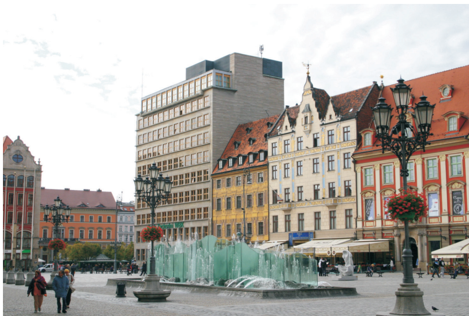
Fot. 1. Wrocław, Rynek – kontrowersyjne elementy w granicach zespołu kompozycyjnego starego miasta: budynek biurowy z 1931 roku, fontanna z 2000 roku.

W analizie kompozycyjnej obszar Stare Miasto nie uzyskał najwyższych ocen. W zakresie wykształcenia granic uznano, że cecha ta jest zauważalna na poziomie średnim. Na taką ocenę wpłynęły następujące okoliczności: brak ciągłości ograniczeń, słaba czytelność śladów dawnych murów obronnych, niekompletność rodzajów zabudowy wzdłuż spodziewanego ograniczenia. Słabe granice tego zespołu kompozycyjnego wprowadzają miejscami dezorientację w poruszaniu się po terenie o niejednorodnym – miejscami kontrowersyjnym – stylu zabudowy i zagospodarowania elementami małej architektury (fot. 1.). W najważniejszym