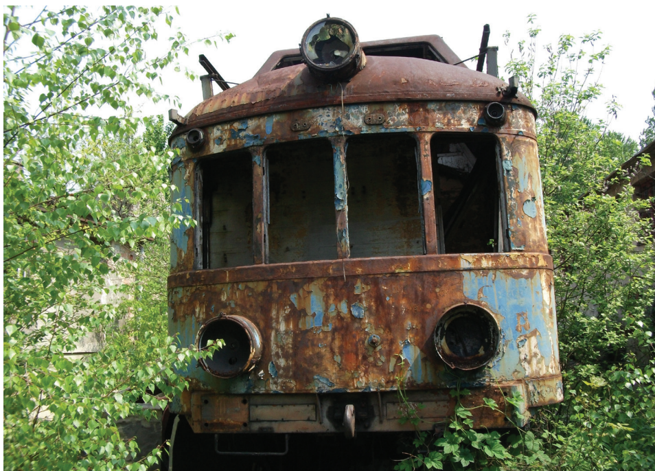
Fot. 7. Wagon rewizyjny SR51, Gliwice