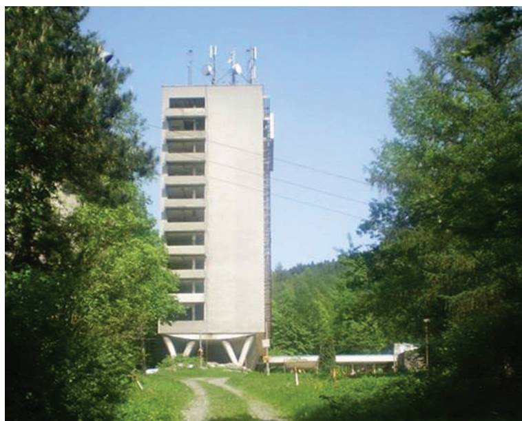
Fot. 8. Szpital Miejski „Stalownik” w Bielsku-Białej, widok na budynek sanatorium