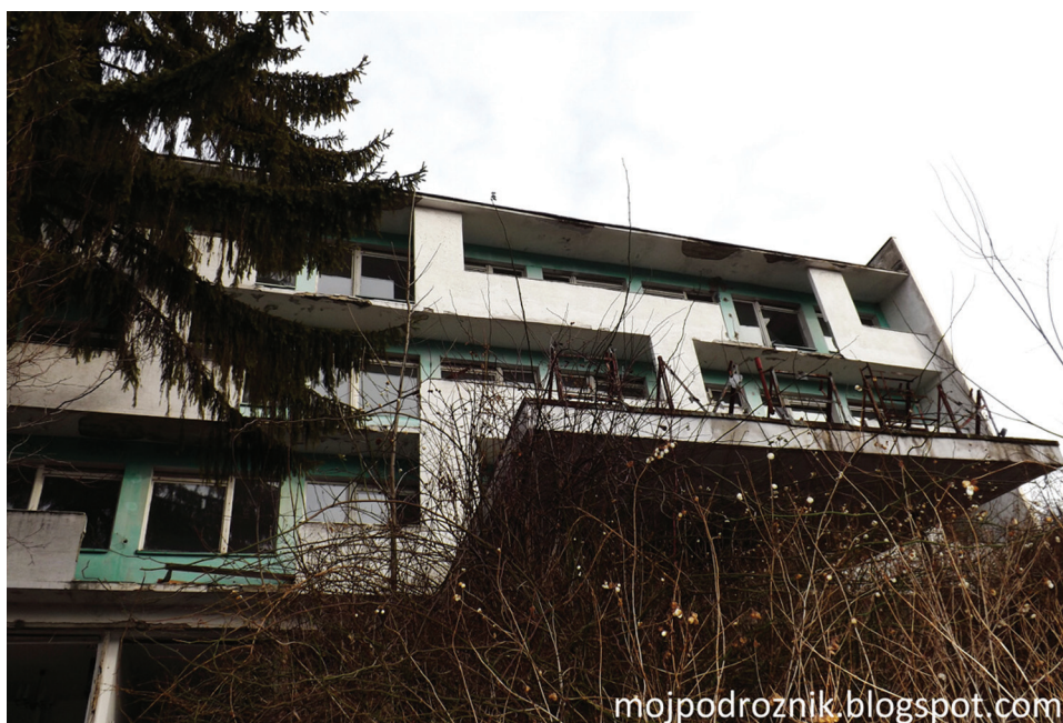
Fot. 3. Opuszczony Dom Wczasowy „Smrek” w Wiśle