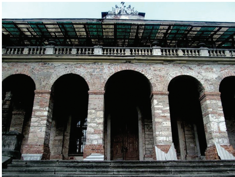
Fot. 9. Pałac w Pilicy, widok ogólny