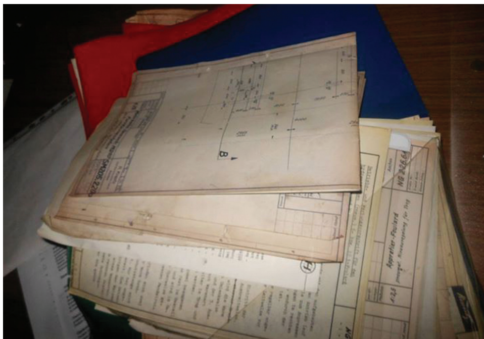
Fot. 6. Dokumentacja technologiczna w opuszczonej Fabryce Włókienniczej „Bewelana” w Bielsku-Białej