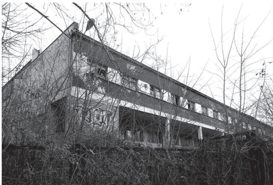
Fot. 5. Opuszczona Fabryka Włókiennicza „Bewelana” w Bielsku-Białej