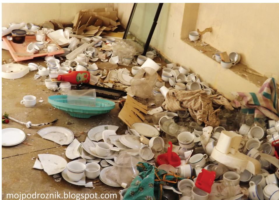
Fot. 4. Kuchnia w opuszczonym Domu Wczasowym „Smrek”