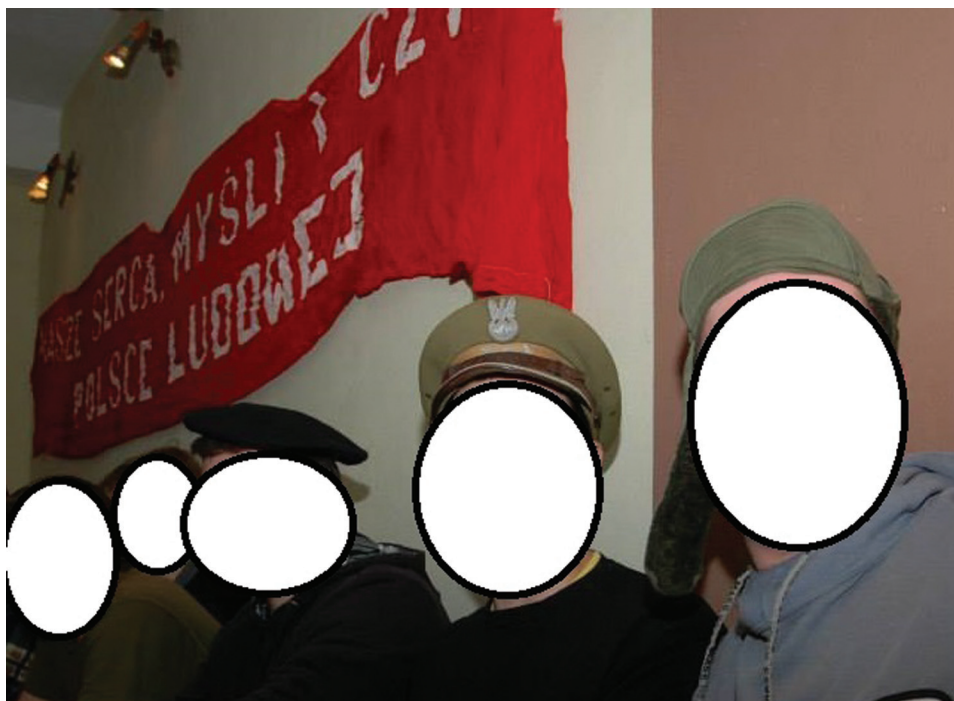
Fot. 2. Przedmioty pochodzące z eksploracji opuszczonych obiektów

Ten zapis Kodeksu karnego jest najczęściej łamany przez eksploratorów, dla których ważniejsze jest wejście do obiektu niż przestrzeganie przepisów. Również zasada dotycząca niezabierania niczego z eksplorowanych obiektów nie jest przez wszystkich przestrzegana. O ile eksploratorzy – w przeciwieństwie do bezdomnych lub osób trudniących się zbieraniem złomu – nie posuwają się do wrywania kabli ze ścian, o tyle już elementy nieprzytwierdzone na stałe są przez nich często zabierane. Fotografia 2. przedstawia zabrane z którejś z warszawskich lub podwarszawskich fabryk transparent z napisem „Nasze serca, myśli i czyny – Polsce Ludowej”, a także berety i czapki wojskowe. Przywłaszczanie „pamiątek” ze zwiedzanych miejsc jest, niestety, plagą, szczególnie wśród początkujących eksploratorów (na niektórych forach zamieszczone są porady dotyczące sposobów dezynfekcji zabieranych przedmiotów).