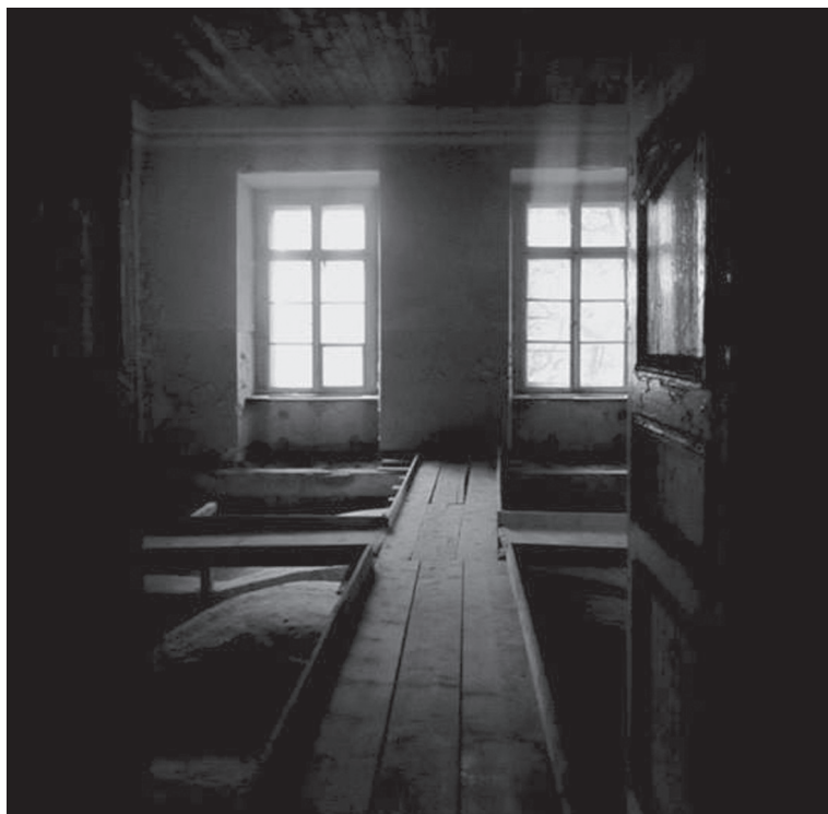
Fot. 10. Wnętrze pałacu w Pilicy