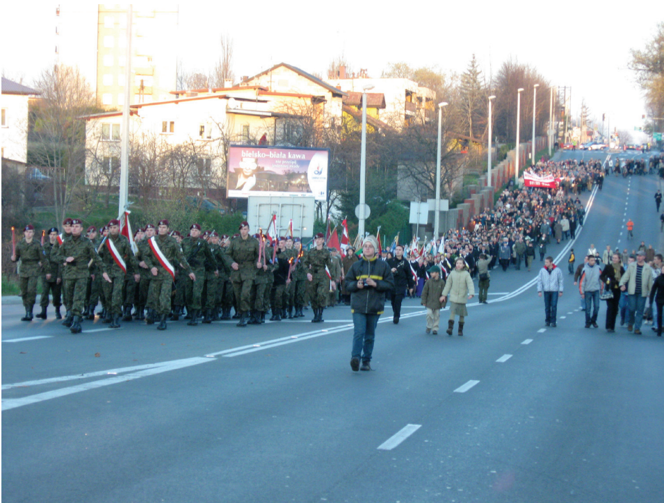
Fot. 2. Patriotyczny pochód ulicami miasta w dniu 11 listopada 2008 roku z okazji 90. rocznicy uzyskania niepodległości

Inną grupę zorganizowanych wystąpień stanowią manifestacje przeciwko dyskryminacji, nawołujące do równego traktowania kobiet bądź mniejszości seksualnych. Co jakiś czas w sferze politycznej ulicy zaznaczają swoją obecność również przedstawiciele organizacji ekologicznych. Nie sposób pominąć tutaj także rozmaitych grup zawodowych, wspieranych przede wszystkim przez związki zawodowe, a niekiedy przez różne inne organizacje oraz opozycyjne partie polityczne.