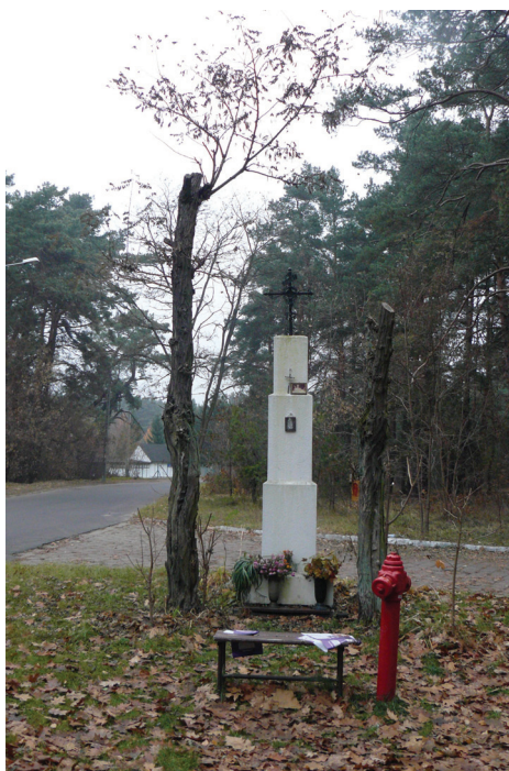
Fot. 6. Kapliczka jako samodzielnie zaaranżowane miejsce spotkań sąsiedzkich (fot. D. Krug, 2011)