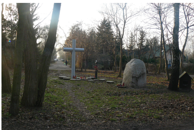
Fot. 2. Kulturowy wymiar przywiązania, przykłady: rynek, przestrzeń publiczna, miejsce pamięci