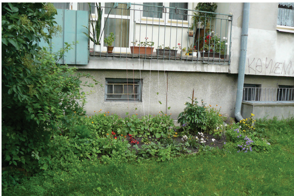
Fot. 5. Rabaty przed blokami (fot. D. Krug, 2013)