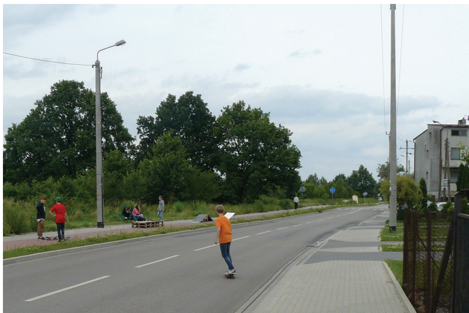
Fot. 7. Samodzielnie wykonane elementy skateparku