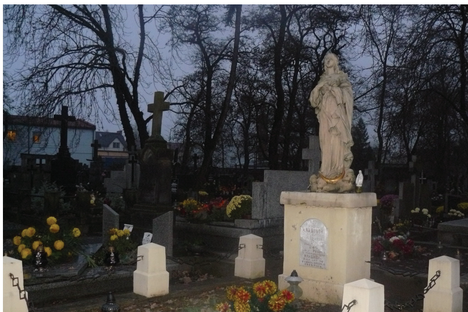
Fot. 1. Sakralny wymiar przywiązania, przykłady: kościół, kapliczka, cmentarz