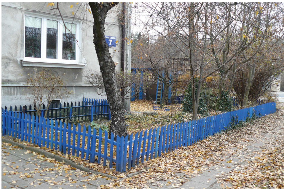
Fot. 3. Indywidualny wymiar przywiązania, przykłady: podwórko osiedlowe, ogródek lokatorski (fot. D. Krug, 2012)