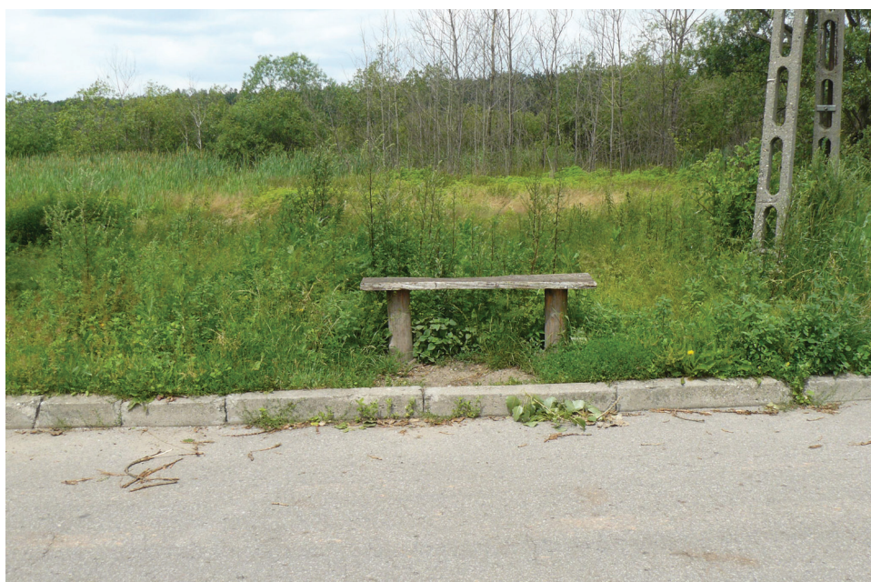
Fot. 8. Ławeczka przydrożna