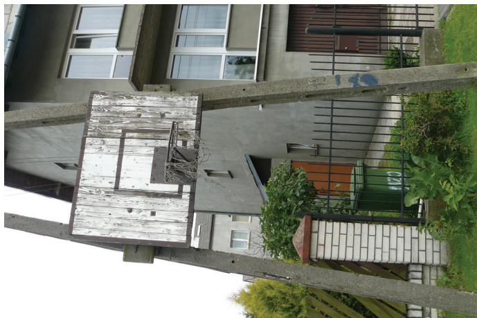
Fot. 4. Miejsca i obiekty szczególnej identyfikacji ludzi z krajobrazem: ogródek w środku podwórka osiedlowego, lesne miejsce spotkań, kosz do koszykówki zawieszony na słupie ulicznym