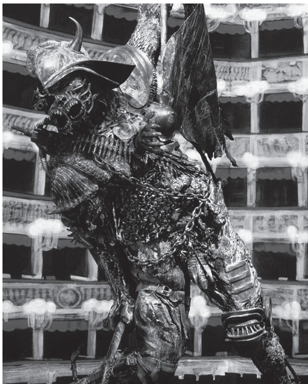
Il. 3. Robert Long, „All You Zombies: Truth before God”, instalacja, 1986 r.

nicję. Z klatki piersiowej wystaje kobieca dłoń, jakby jakaś postać uwięziona wewnątrz żołnierza-cyborga próbowała wydostać się na zewnątrz. Ugięte, wykręcone nogi zakończone płetwami i stawy kolanowe, z których wystają szczęki, owady rojące się przy genitaliach oraz małe żołnierzyki uczone wewnętrzności sugerują, że mamy do czynienia z jakąś ludzką postacią, a zarazem nie-ludzką bestią. Robert Hughes uważa, że ta rzeźba-instalacja wskazuje na to, jak ciała współczesnych żołnierzy, ich sprawność i wydajność są formowane przez wysoko zaawansowaną technologię, czyniąc je ściśle związanymi z technonauką w służbie polityki. W tym sensie żołnierz-cyborg jawi się jako „produkt” militarystyki i kapitalizmu. Longo nie afirmuje jednak mariażu militarystyki z kapitalizmem, jego utwór jest wyrazem sprzeciwu wobec tych relacji, dla których bardziej adekwatnymi reprezentacjami są filmowi bohaterowie, tacy jak Terminator czy RoboCop. Natomiast hybrydyczna, ludzko-zwierzęco-techniczna rzeźba amerykańskiego artysty wyraża raczej gniew człowieka współczesnego wobec własnej kondycji określanej przez zmilitaryzowany kapitalizm. Jego tożsamość postrzegana przez pryzmat siły i dokonywanych przemian cywiliza-