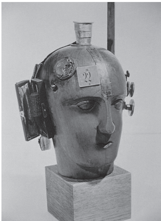
Il. 2. Raul Hausmann, „Tête Mécanique” („Mechaniczna głowa”), instalacja, 1919 r.

wieku), ale prowokuje już do stawiania pytań o to, co dzieje z ludzkim ciałem, psychiką, emocjonalnością — z człowiekiem pozostającym z ścisłych relacjach z wytworami technologicznymi. „Mechaniczna głowa” przez nagromadzenie rozmaitych przedmiotów wykonanych z drewna, metalu, kartonu i skóry wyraża uprzemysłowionego, industrialnego „ducha swego czasu”. Krytyk sztuki modernistycznej, Timothy O. Benson uważa, że artysta poprzez stłoczenie tak różnych przedmiotów, jak: kubek, portfel, miara, pokrętła, blaszki, składających się na „Mechaniczną głowę”, ukazał człowieka uwięzionego w swym niepokoju i enigmatycznej przestrzeni, który postrzega świat poprzez maskę arbitralnie zestawionych symboli 6 . Jeśli jednym z wyznaczników nowoczesności było kolekcjonerstwo przedmiotów, ale także wrażeń i doświadczeń 7 , to instalacja