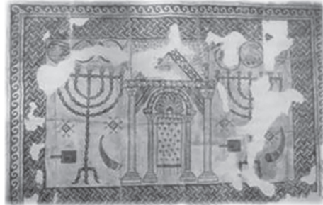
Il. 7. Mozaika z synagogi samarytańskiej w Bet Szean, VI w. (za: G. Sed-Rajna, Ancient Jewish Art , il. 21)

nie tendencji antycesarских wśród społeczności żydowskiej 63 . Po roku 70 n.e. motyw palmy stał się popularnym elementem dekoracyjnym stosowanym przez Żydów zarówno w kontekście sztuki synagogałnej, jak i sepulkralnej. Palma daktylowa, zredukowana do schematycznie opracowanej gałązki palmowej, utożsamianej z lulawem, wyrażała przede wszystkim pamięć o świątyni jerozolimskiej i uroczystych obchodach święta Sukkot. Ta identyfikacja symbolu ze zniszczonym budynkiem świątynnym była wyrazem tęsknoty i nadziei na powtórny odbudowę Przybytku i ponowne ustanowienie celebracji rytualnych. Tym samym dekoracje budynku synagogi oraz innych zabytków tego okresu