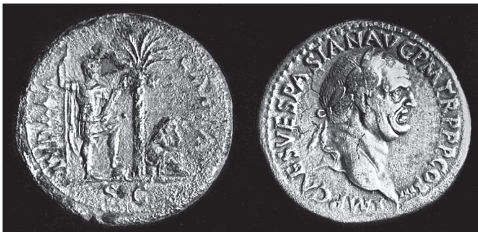
Il. 1. Moneta rzymska z serii Judaea Capta (za: G. Sed-Rajna, Ancient Jewish Art , Paris 1985, s. 36)

nowej dynastii cesarskiej 16 . Jednym z motywów zamieszczanych na rewersie monet było właśnie przedstawienie palmy daktylowej, Phoenix dactylifera [il. 1], które obok wizerunków skrępowanych więźniów: kobiety i mężczyzny, było utożsamiane z prowincją Judaea 17 .