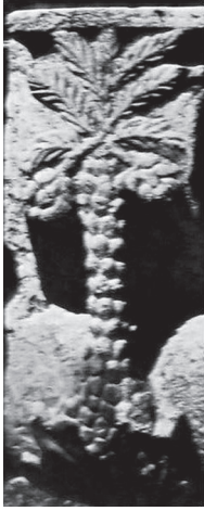
Il. 4. Konsola portalu głównego z wyobrażeniem palmy daktylowej, synagoga w Kafarnaum, III–IV w.