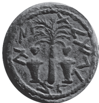
Il. 2. Moneta żydowska z okresu powstania pierwszego powstania żydowskiego (66–70) (za: Y. Meshorer, Les Monnaies Anciennes: un Temoignage , Israel Museum, Jerusalem 2000, s. 9)