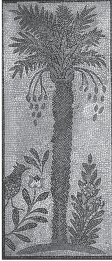
Il. 6. Mozaika synagogaalna, Hammam Lif, V w., fragm. z przedstawieniem palmy, Muzeum Brooklińskie, Nowy Jork (za: R. Hachlili, Ancient Jewish Art , il. IV-23)