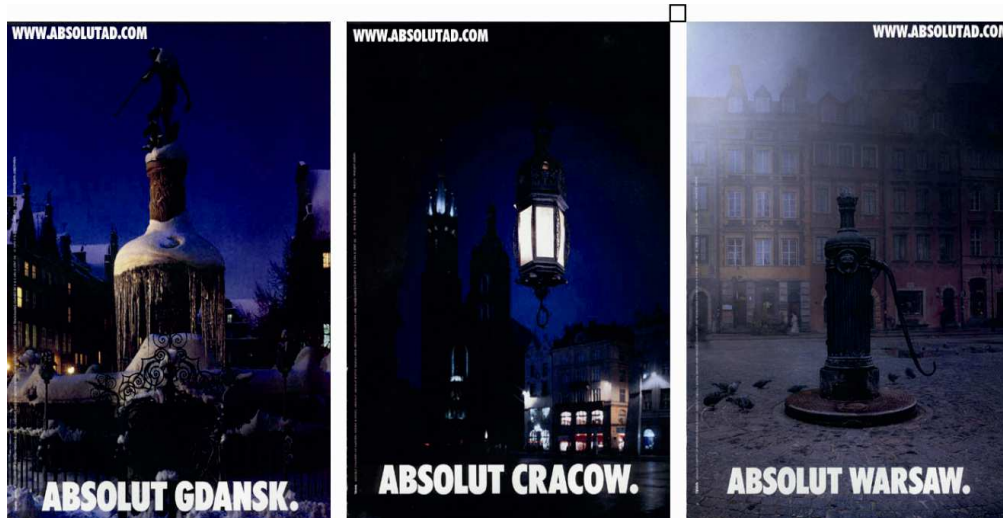
Rysunek 12. Fotografie polskich miast w kampanii promocyjnej Absolut Cities Źródło: http://www.absolutad.com/absolut_gallery/cities/ (dostęp: 23.11.2017).

W reklamowej kolekcji znalazły się również polskie miasta – Gdańsk, Kraków i Warszawa.