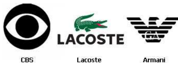
Rysunek 5. Znaki symboliczne