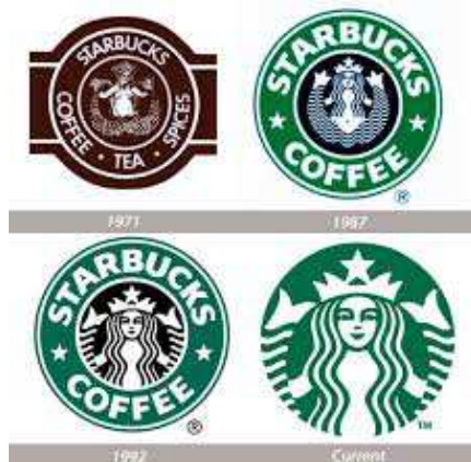
Rysunek 9. Logo Starbucksa na przestrzeni lat

Logo koncernu zmieniało się na przestrzeni lat. W pierwszej wersji utrzymywano je w brązowych barwach, a syrena miała odkrytą klatkę piersiową. Dziś logo jest zielone, piersi syreny zostały zakryte jej włosami. Logotyp pozbawiono także charakterystycznego napisu „Starbucks Coffee”, w związku ze zmianami, jakie przygotowuje korporacja: Mimo że zawsze byliśmy i będziemy dystrybutorem kawy, możliwe, że będziemy sprzedawać również produkty, które będą sygnowane marką Starbucks, a nie będą zawierały kawy – wyjaśnia Howard Schultz, prezes firmy 20 .