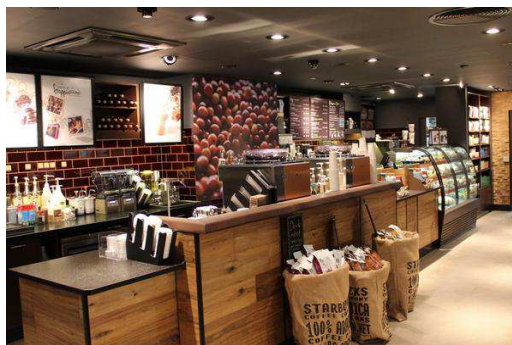
Rysunek 8. Kawiarnia Starbucks na Dworcu Centralnym w Warszawie