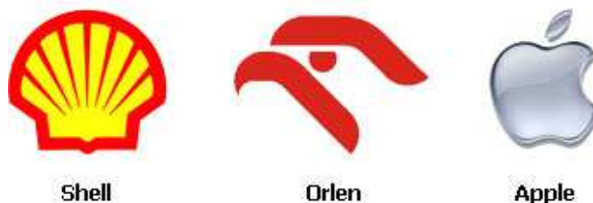
Rysunek 3. Znaki inspirowane nazwą organizacji