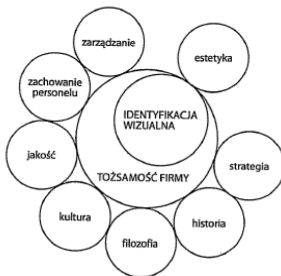
Rysunek 1. Tożsamości firmy, identyfikacja wizualna