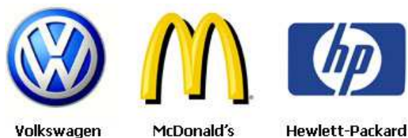
Rysunek 7. Znaki inspirowane literami i cyframi