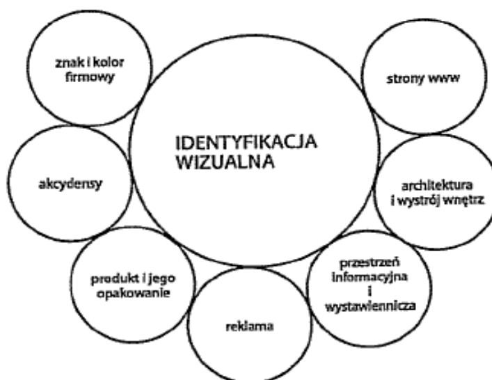
Rysunek 2. Elementy identyfikacji wizualnej firmy