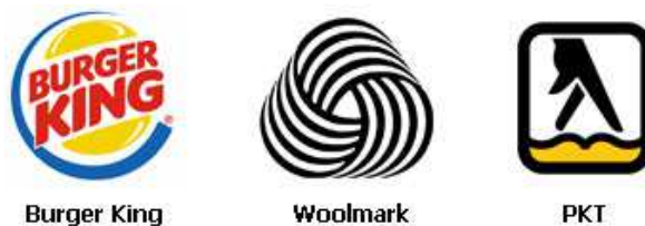
Rysunek 4. Znaki tematyczne