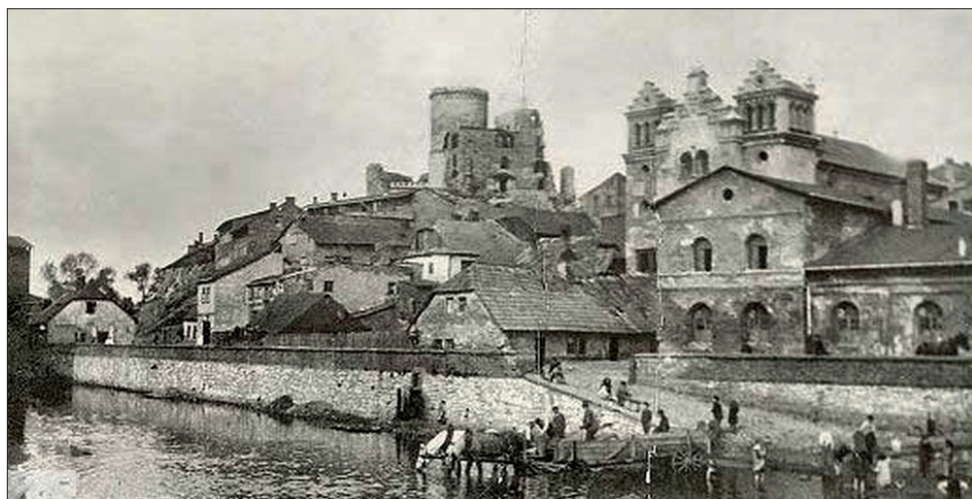
Zdjęcie 1. Widok na zamek w Będzinie i synagogę w początkach XX wieku, autor nieznan

Źródło: http://www.sztetl.org.pl/pl/article/bedzin/11,synagogi-domy-odlitwy-i-inne/495,synagoga-w-bedzinie-wzgorze-zamkowe/