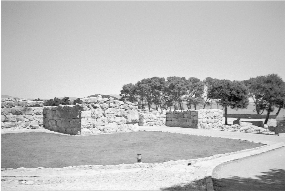
Fig. 3. Brama greckiego Emporion