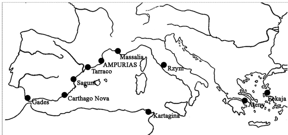
Fig. 1. Rejon Morza Śródziemnego – usytuowanie Ampurias