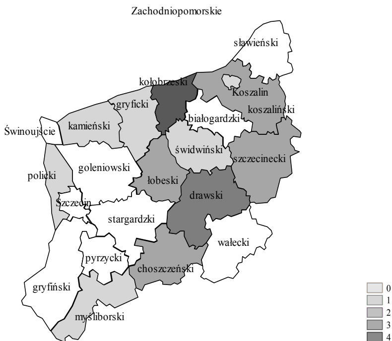
Rysunek 2. Liczba powiatów sąsiadujących z danym powiatem i ze skointegrowaną stopą bezrobocia