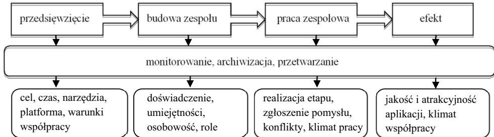
Rysunek 4. Model monitorowania pracy zespołów CD NIWA