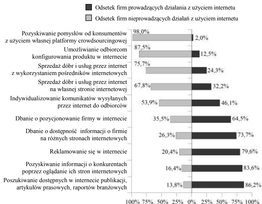
Rysunek 2. Zakres wykorzystania crowdsourcingu na tle innych działań marketingowych prowadzonych z wykorzystaniem internetu (odsetek przedsiębiorstw)