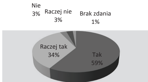
Rysunek 2. Odpowiedzi na pytanie: Czy Pana(i) zdaniem powinny zostać podjęte działania, mające na celu zainwestowanie w rozwój turystyki i podążanie gminy w tym kierunku?