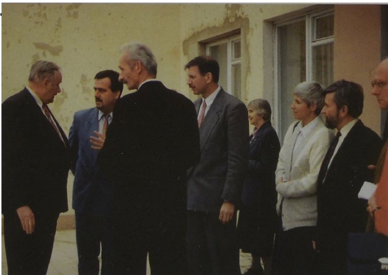
Fot. 2 Władze wojewódzkie i gminne przed gmachem nowej siedziby Muzeum