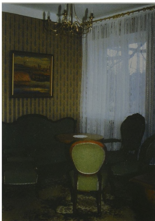
Fot. 4 Wnętrza nowej siedziby Muzeum