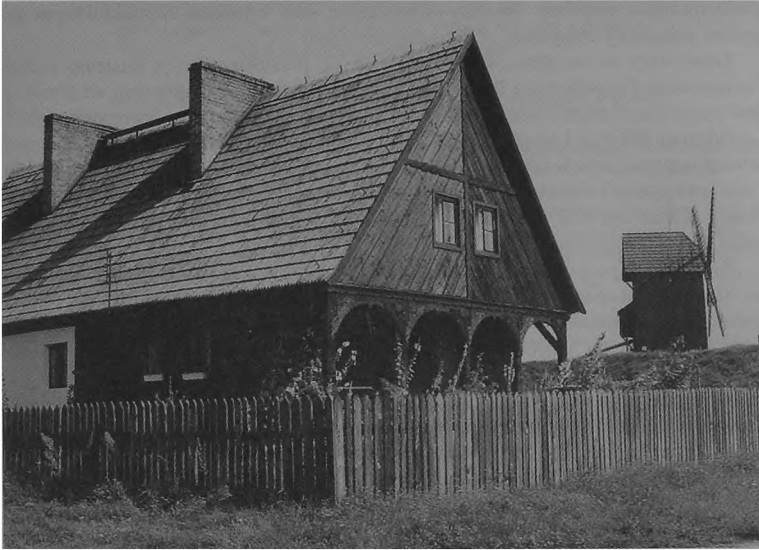
6. Punkt etnograficzny w Moraczewie — fragment ekspozycji.

instytucją interdyscyplinarną łączącą (na obecnym etapie dość luźno) nauki humanistyczne z przyrodniczymi o strukturze instytucjonalnej obejmującej: