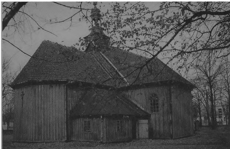
5. Osiemnastowieczny kościół zrębowy, Wartkowiece k/Uniejowa (stan z 1997 r.). Obiekt przeniesiony do WPE.

Przenosi się kolejne 23 obiekty, a na kilkunastu prowadzi prace montażowe i wykończeniowe. Ostatecznie w tym etapie zakończono realizację budowy na 26 obiektach, co łącznie dało 41 obiektów całkowicie wykończonych z czego w 25 znalazły się różne ekspozycje, zaś w pozostałych 16-stu pracownie, pomieszczenia administracyjne, gospodarcze, magazyny, kasa, pkt. gastronomiczny oraz mieszkania. W tym miejscu należy nadmienić, że na terenie skansenu znajduje się 7 mieszkań, a wśród nich dwa bezpośrednio w oryginalnych zagrodach (łącznie muzeum posiada 20 mieszkań).