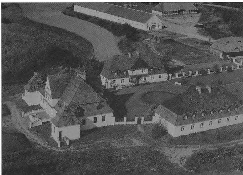
Ryc. 4. Wielkopolski Park Etnograficzny — fragment zespołu dworsko-folwarcznego.

nie wybranych, szeroko rozumianych muzealiów ma stać się etnograficznym metoni- mem kultury wsi wielkopolskiej.