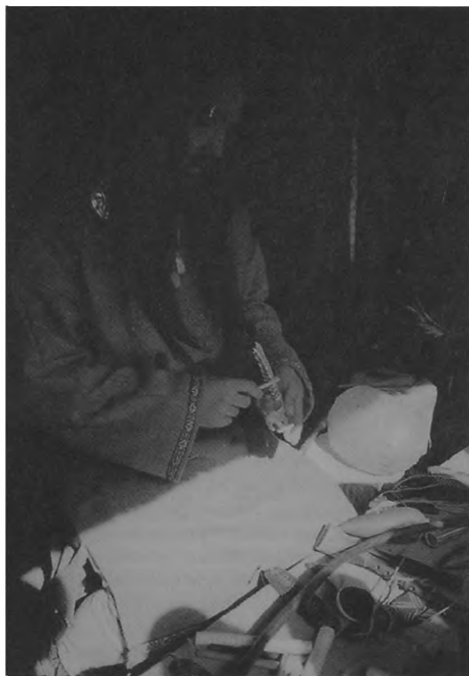
Ryc. 1. Biskupin — stoisko z instrumentami muzycznymi.