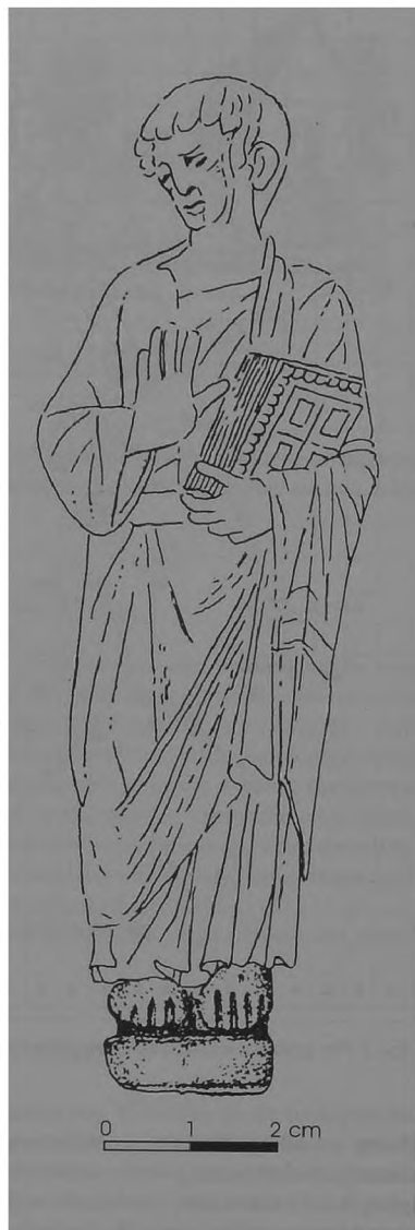
Ryc. 4. Rekonstrukcja figurki na oryginalnej podstawce wg Andrzeja Kaszubkiewicza (rys. D. Mania)