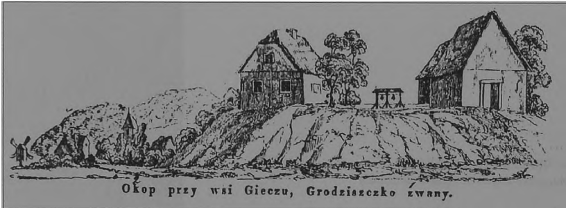
Ryc. 1. Widok na grodzisko w Gieczu, kościół, dzwonicę i starą plebanię. W głębi wsi romański kościół i wiatrak (pierwsza poł. XIX w.)

sokość całego przedmiotu wynosi 18 mm. Prawa krawędź podstawy uległa zniszczeniu. Jednak nie przeszkadza to w określeniu jej szerokości, bowiem zachowały się trzy, lekko sfazowane, naroża podstawki.