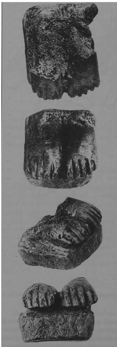
Ryc. 3. Podstawka figurki rogowej w 4 ujęciach