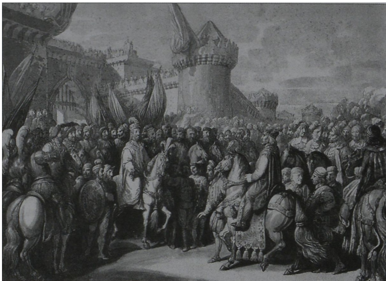
Ryc. 3 F. Smuglewicz powitanie cesarza Ottona III przez Bolesława Chrobrego w Poznaniu - litografia