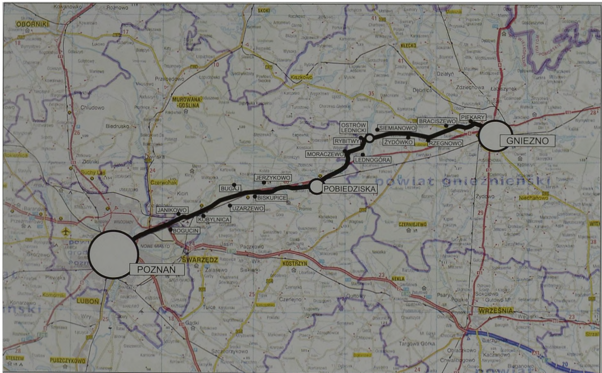
Ryc. 1 Główny szlak z Poznania do Gniezna przechodził przez Ostrów Lednicki