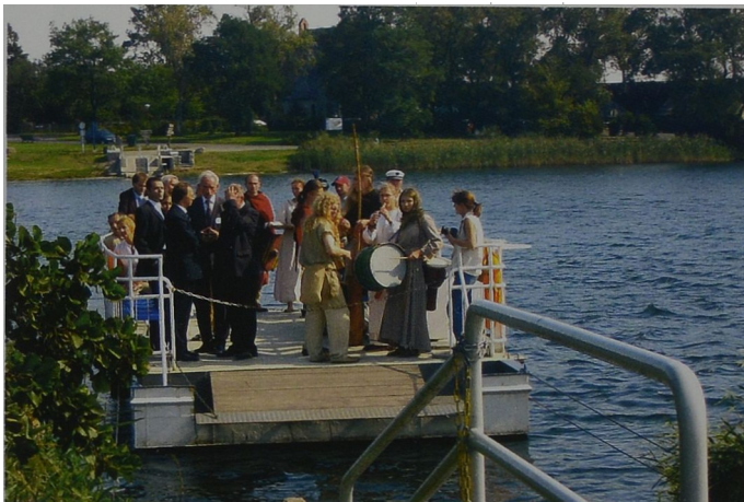
Ryc. 2 Przeprawa zaproszonych gości na Ostrów Lednicki Abb. 2 Übergang der eingeladenen Gäste auf Ostrów Lednicki