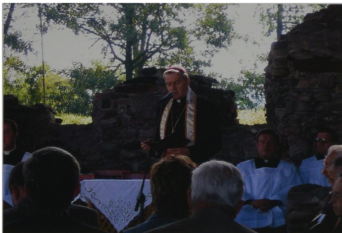
Ryc. 5 Biskup Grzegorz Balcerek z Poznania wygłaszający homilię Abb. 5 Bischof Grzegorz Balcerek aus Posen, der eine Homilie hält