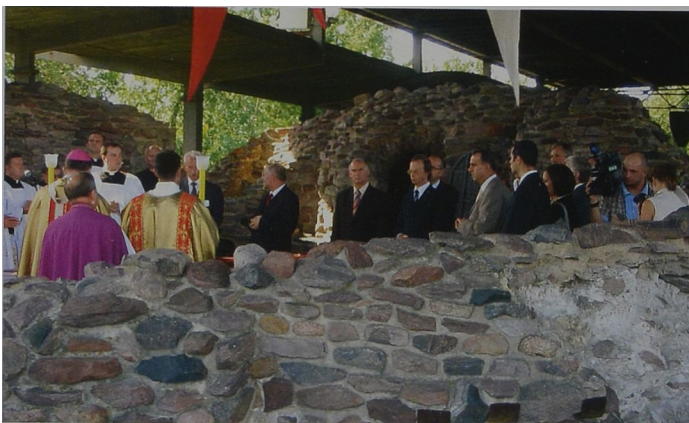
Ryc. 3 W trakcie mszy świętej Abb. 3 Während der Heiligen Messe