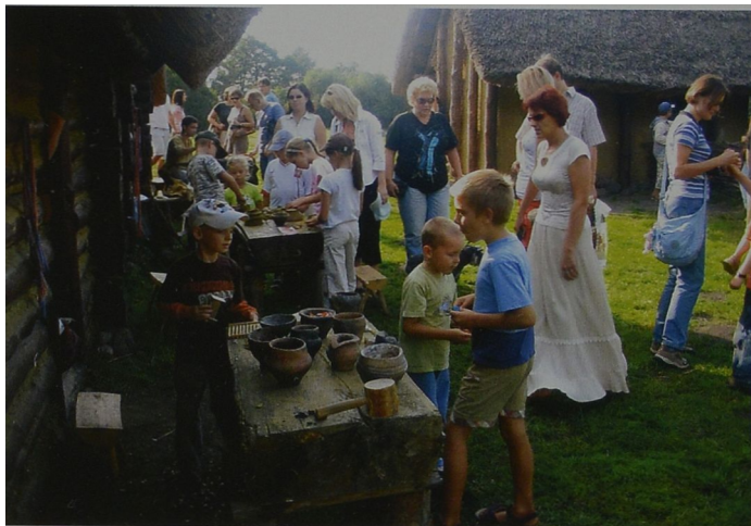
Ryc. 8 W "ożywionej" zagrodzie. Abb. 8 Im "belebten" Hof