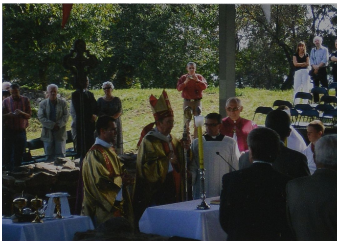
Ryc. 4 Metropolita Gnieźnieński Arcybiskup Henryk Muszyński w trakcie odprawiania mszy Abb. 4 Metropolit von Gnesen Erzbischof Henryk Muszyński während der Abhaltung der Messe