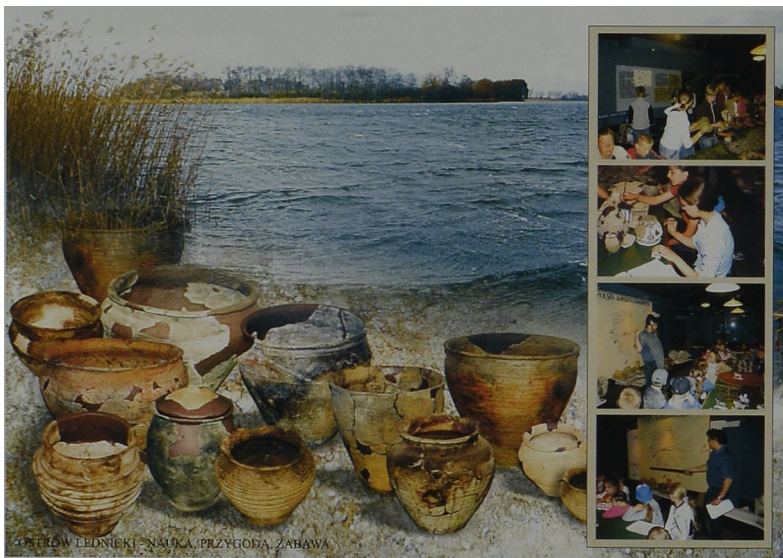
Foldery i kartka pocztowa, które towarzyszą zajęciom. Faltprospekte und Postkarte, die den Unterricht begleiteten