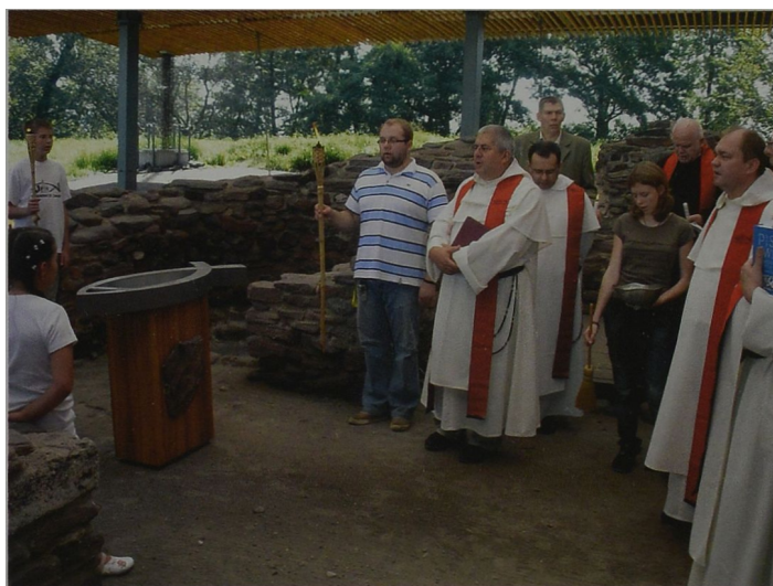
Ryc. 2 Uroczystości w lednickim baptyserium Abb. 2. Die Feierlichkeiten im Lednizer Baptisterium