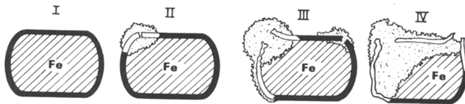
Ryc. 2. Schemat działania korozji na odważniki żelazne w brązowych koszulkach; wg Sperber 1996, fig. 4.3