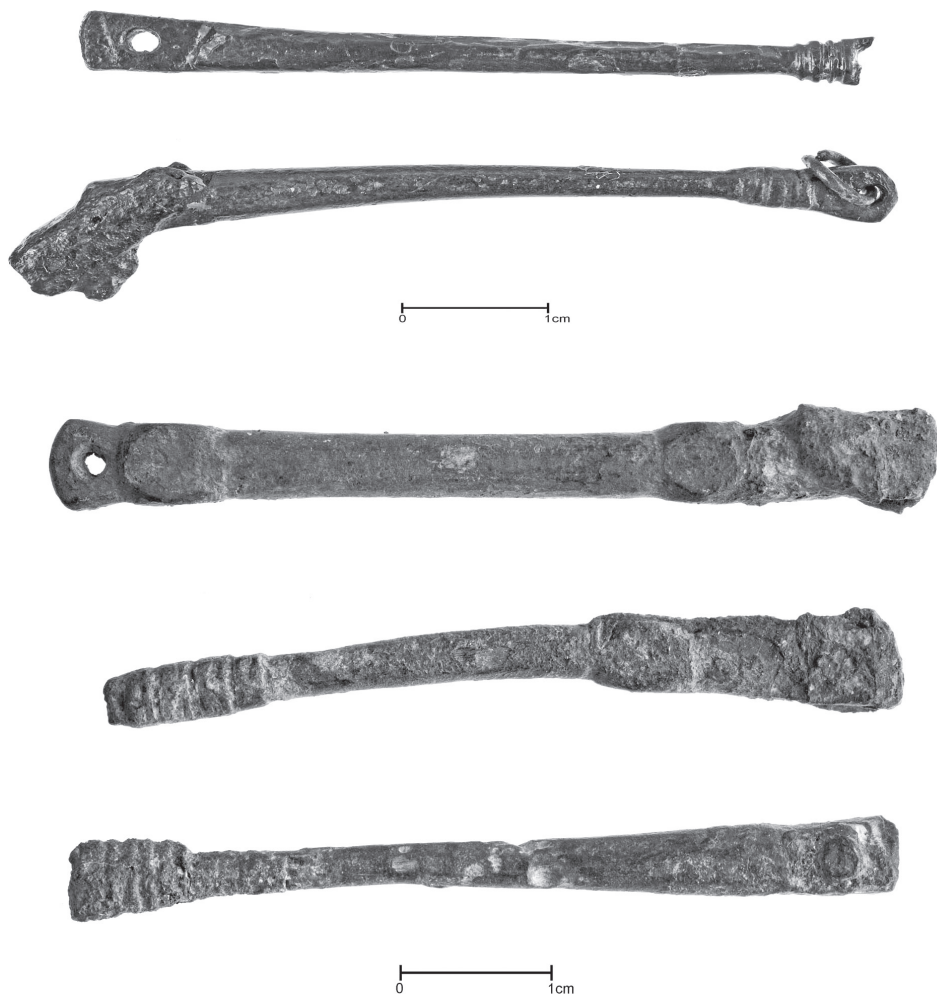
Ryc. 1. Ramiona wag składanych z Giecz: a) CL 15446, inw. 143/60, b) CL 15448, inw. 44/02, c) CL 15450, inw. P167/07, d) CL 15451, inw. P275/07, e) CL 15444, inw. 423/50

By spróbować odpowiedzieć na to pytanie, potrzebna jest analiza ilościowa, a następnie skonfrontowanie jej z wynikami analizy archeologicznej. Takie podejście do badań fizykochemicznych pomoże uzyskać najtrafniejsze wnioski. Najpierw przyjrzymy się zawartościom pierwiastków szkodliwych dla właściwości stopu: antymonowi, arsenowi i bizmutowi. Zabytki grupują się według czterech podobnych, ale jednak różnych zawartości tych pierwiastków. Najliczniejsza grupa skupiająca cztery egzemplarze (ryc. 1.: CL: 15444, 15448, 15450, 15451) 2 charakteryzuje się