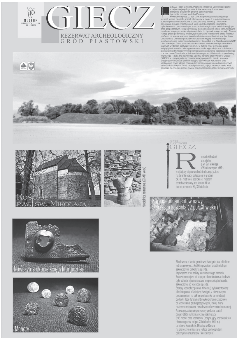
Fot. 3. Informacje dotyczące historii Giecza; skład komputerowy W. Kujawa