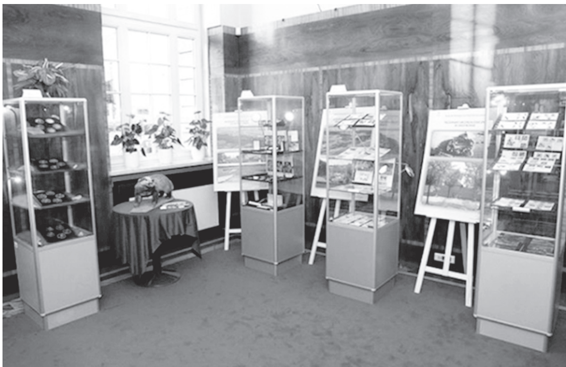
Fot. 1. Fragment sali wystawowej