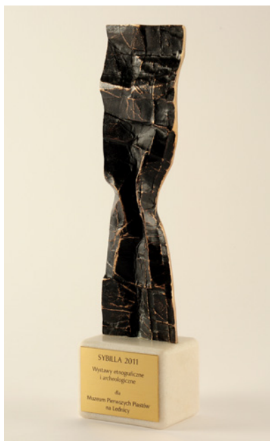
Fot. 1. Sybilla 2011 — statuetka

Równie ważna była dla Muzeum kolejna z nagród, jaką otrzymaliśmy w 10. edycji konkursu na najwybitniejsze wydarzenie muzealne roku w Wielkopolsce Izabella 2012 organizowanej przez Fundację Muzeów Wielkopolskich pod patronatem Marszałka Województwa Wielkopolskiego. 24 maja 2012 roku w gościnnych wnętrzach Muzeum w Dobrzycy na ręce wicedyrektora Muzeum Marka Kręzałka oraz autorów ekspozycji przekazano Grand Prix (statuetkę Izabelli) oraz okolicznościowy dyplom.