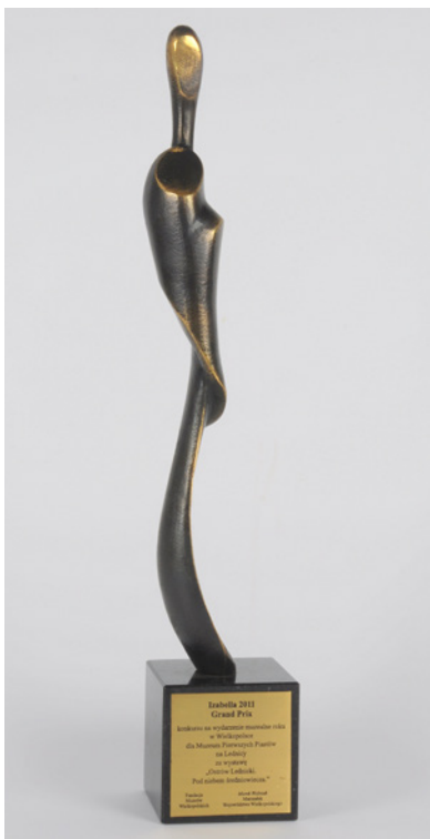
Fot. 3. Izabella 2011 — statuetka; fot. A. Ziółkowski