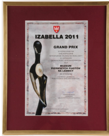
Fot. 4. Izabella 2001–2011 — okolicznościowy dyplom dla Muzeum Pierwszych Piastów