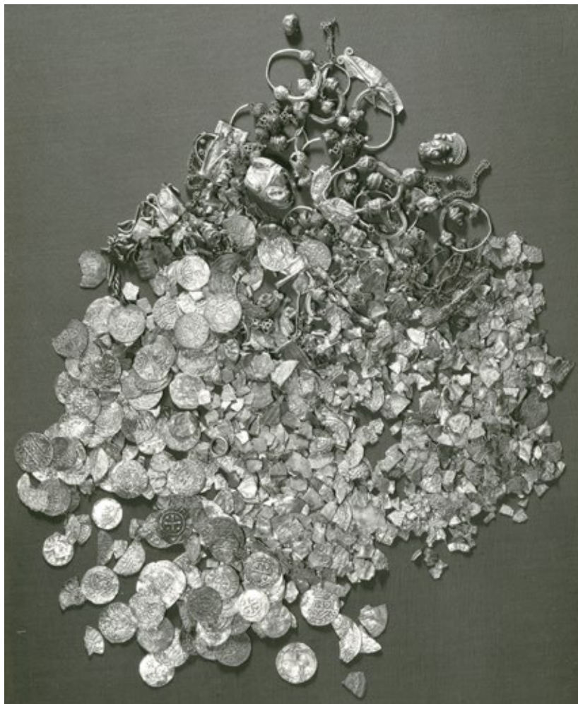
Ryc. 2. Skarb z Kotowic, pow. Wrocław Fig. 2. The Kotowice hoard, Wrocław district

Śląskie skarby ukryte w X stuleciu składały się głównie z monet, surowca srebrnego i ozdób, niekiedy pojawiały się w nich także blankiety. Do sporadycznych znalezisk należą paciorki szklane czy ozdoby miedziane. Nieliczne depozyty gromadziły wyłącznie monety; pozostałe zawierały różnorodne składniki, a odsetek monet w nich waha się od ok. 0,4% (Śląsk XIII) do 99,7% w Lasowicach. Cechą charakterystyczną tych zespołów jest ich siekańcowy charakter: ok. 33% zawierało wyłącznie srebro pokawałkowane, kolejne 26,7% — większość zabytków podzieloną, ok. 20% składało się w większości z monet całych, a jedynie zespół Śląsk IV tworzyły wyłącznie denary niepodzielone. Na część niemonetarną tych skarbów składają się ozdoby, placki srebrne, bryłki kruszcu, sztabki, druty oraz blankiety. Surowiec srebrny zawierało ok. 26% depozytów, a jego odsetek waha się od ok. 20% w Sośnicy