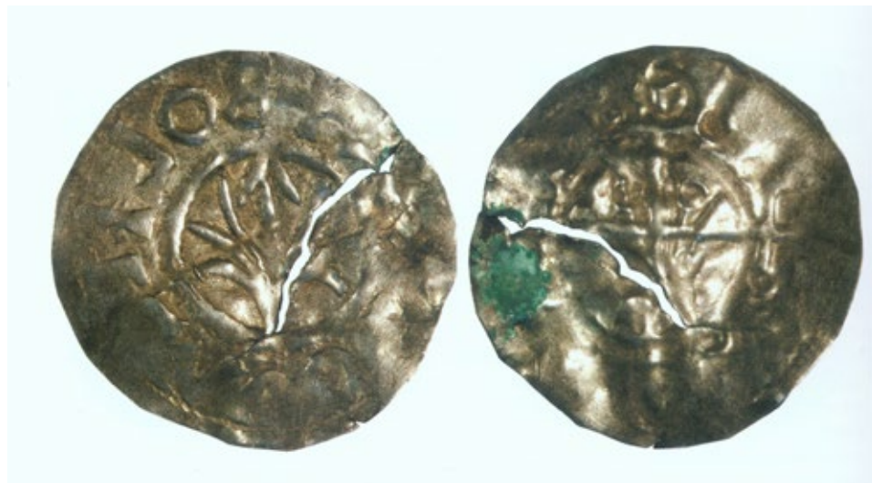
Ryc. 3. Denar Bolesława Chrobrego ze skarbu Kalisz-Rajsków, skala ok. 3:1, wg BOGUCKI, MIŁEK 2010

Fig. 3. Denar of Bolesław the Brave from the Kalisz-Rajsków hoard, scale ca. 3:1, after BOGUCKI, MIŁEK 2010