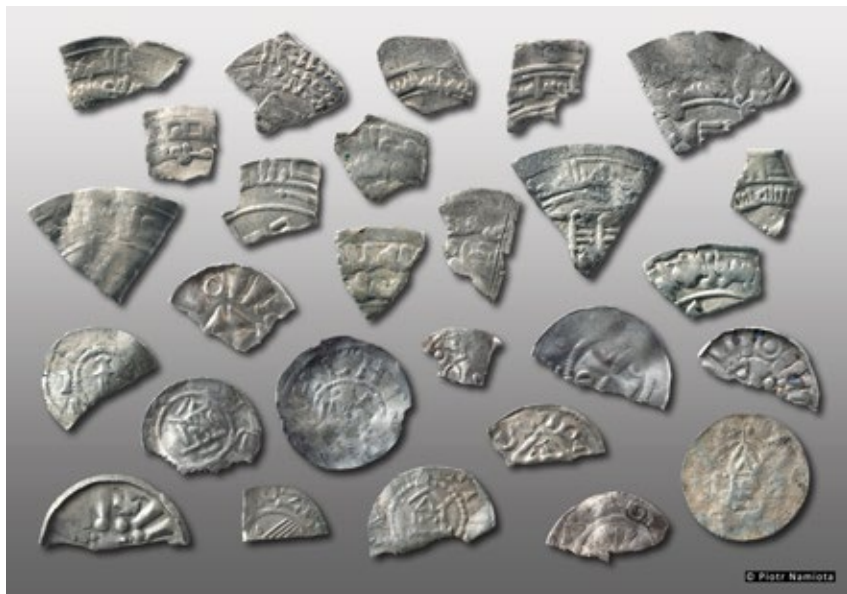
Ryc. 7. Wybór monet III części skarbu (dirhemy i monety zachodnioeuropejskie) z Tarnowa (Łekna); fot. P. Namiota

Fig. 7. Selection of coins from Part III of the hoard (dirhams and West European coins) from Tarnowo (Łekno); photog. P. Namiota