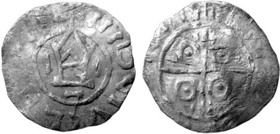
Ryc. 3. Denar Bolesława Chrobrego z Tarnowa Pałuckiego. Powiększenie — średnica oryginału 18,5–19,5 mm; za BOGUCKI 2006b, ryc. 1 i tab.1

Fig. 3. Denar of Bolesław the Brave from Tarnowo Pałuckie. Magnification — diameter of the original specimen 18.5–19.5 mm; after BOGUCKI 2006b, Fig. 1 and Tab. 1