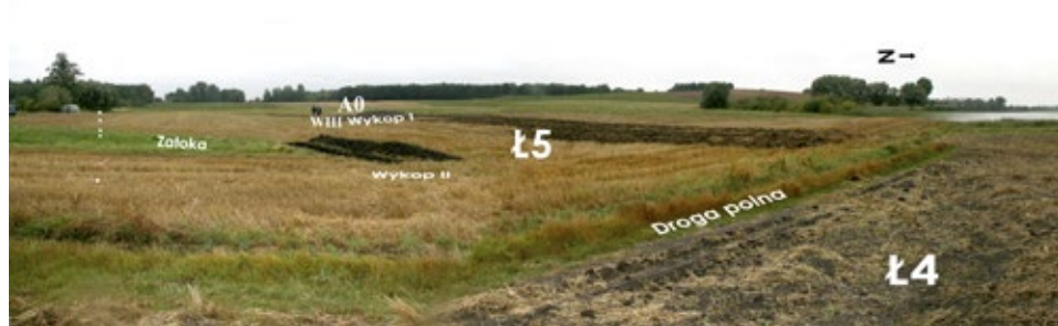
Ryc. 6. Fragment stan. Ł5; fot. i oprac. A.M. Wyrwa Fig. 6. Fragment of Site Ł5; photog. and processing by A.M. Wyrwa

ilości znalezisk z 2004 roku i nie ma pewności, czy posiadamy wyczerpujące dane co do znalezisk związanych ze skarbem z 1861 roku. Uogólniając jednak, uznać można, że skarb z Tarnowa (Łekna) — łącznie część I, II i III — należy do skarbów dużych.