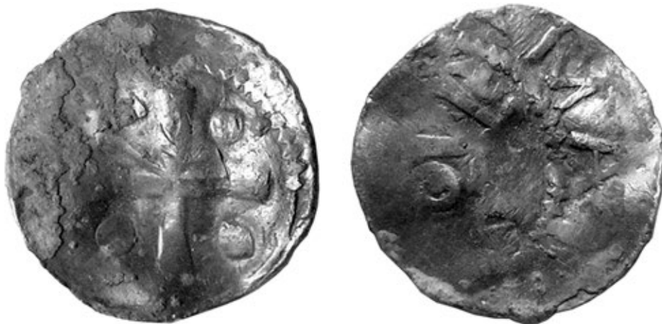
Ryc. 9. Łekno. Denar Ottona III. Powiększenie — średnica oryginału 16 mm; za BOGUCKI 2006a, s. 100, ryc. 10

Fig. 9. Łekno. Denar of Otto III. Magnification—diameter of the original specimen 16 mm; after BOGUCKI 2006a, p. 100, Fig. 10