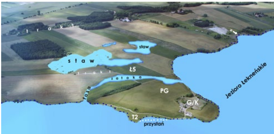
Ryc. 4. Rekonstrukcja środowiska naturalnego w rejonie grodu i klasztoru w Łeknie, zdjęcie lotnicze; fot. Archiwum Urzędu Gminy Wągrowiec, oprac. A.M. Wyrwa

Fig. 3. Denar of Bolesław the Brave from Tarnowo Pałuckie. Magnification — diameter of the original specimen 18.5–19.5 mm; after BOGUCKI 2006b, Fig. 1 and Tab. 1