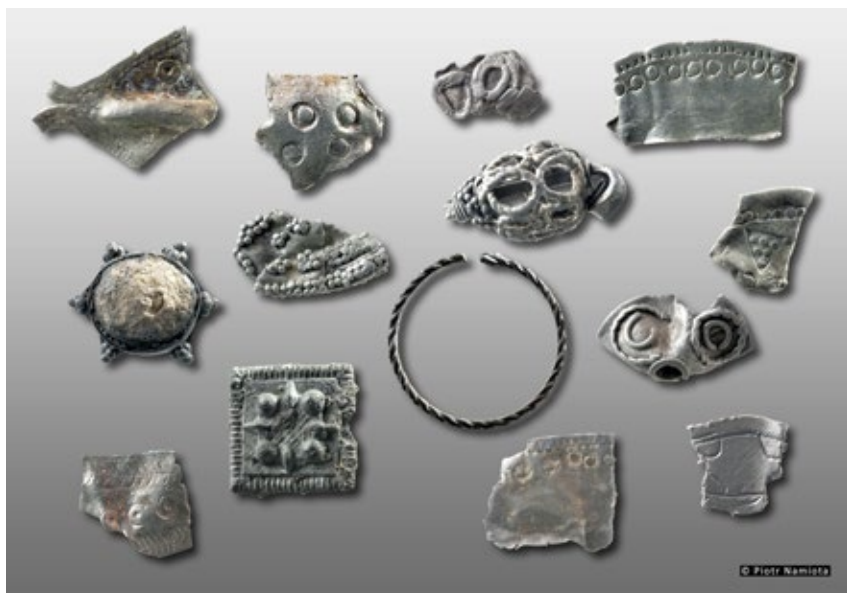
Ryc. 8. Wybór biżuterii z III części skarbu z Tarnowa (Łekna); fot. P. Namiota

Fig. 7. Selection of coins from Part III of the hoard (dirhams and West European coins) from Tarnowo (Łekno); photog. P. Namiota