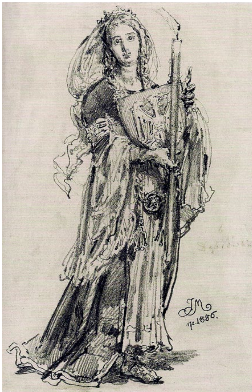
Ryc. 6. Księżna Dobrawa, szkic Jana Matejki do projektu witraża dla katedry św. Wita w Pradze 1886; za Ożóg 2016, s. 91

Fig. 6. Duchess Dobrawa, a sketch by Jan Matejko of a stained glass design for St Vitus Cathedral in Prague – 1886; after Ożóg 2016, p 91