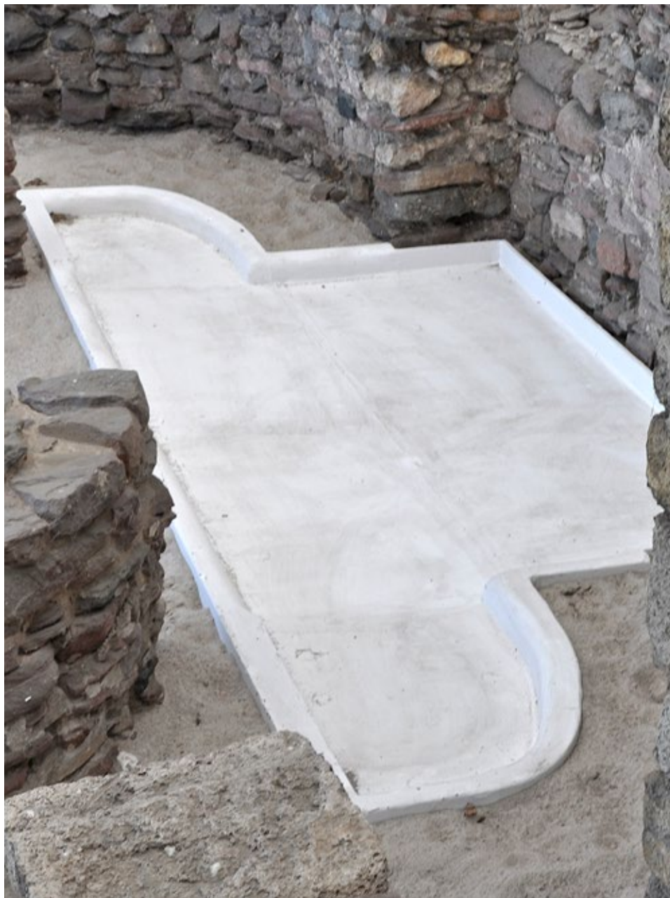
Ryc. 9. Rekonstrukcja południowego basenu chrzcielnego w fazie I; fot. Mariola Józwickowska