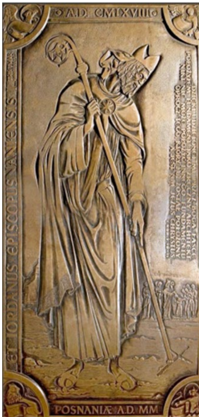
Ryc. 10. Brązowa płyta epitafijna biskupa Jordana w bazylice archikatedralnej w Poznaniu; fot. Piotr Walichnowski (2000)

Fig. 10. Bishop Jordan's bronze epitaph slab in the Archcathedral Basilica of St Peter and St Paul in Poznań; photo Piotr Walichnowski (2000)