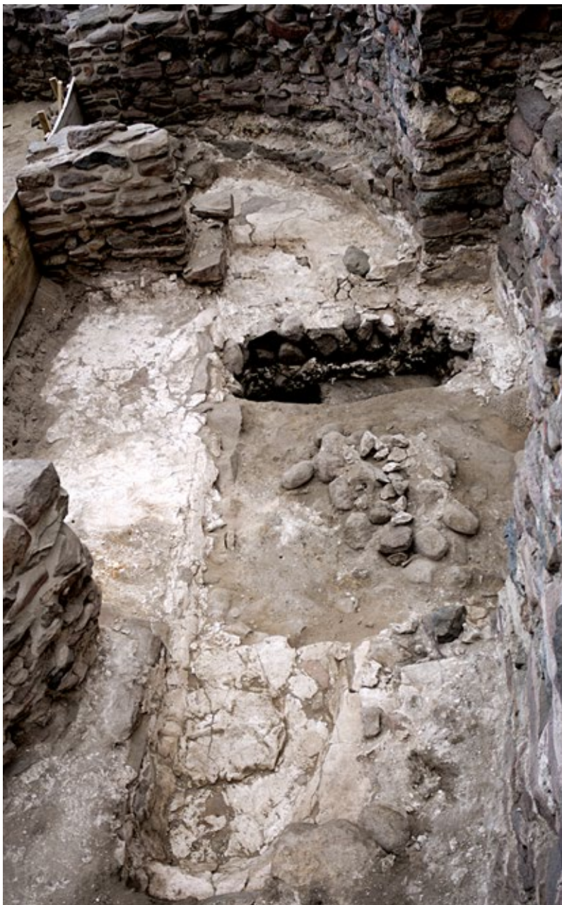
Ryc. 8. Ostrów Lednicki: południowy basen chrzcielny, widok od zachodu, stan z listopada 2016; fot. Mariola Józwickowska

Fig. 8. Ostrów Lednicki — southern baptismal font, west view (November 2016); photo Mariola Józwickowska