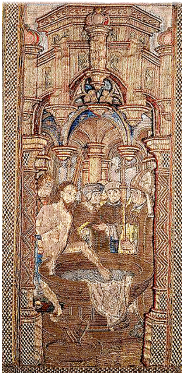
Ryc. 3. Haft przedstawiający legendę o niedoszłym chrzcie Radboda z ręki św. Wulframa, tutaj zastąpionego błędnie przez św. Wilibrorda, Museum Catharijneconvent, Utrecht; pl.wikipedia.org/wiki/Radbod_(król_Fryzów) (odczyt 16.11.2016)

Fig. 3. Embroidery depicting the legend in which Radbod is ready to be baptised by Wulfram (in this embroidery replaced by Willibrord), but at the last moment refuses (Catharijneconvent Museum, Utrecht); source: https://en.wikipedia.org/wiki/Redbad,_King_of_the_Frisians (online access 11.12.2016)