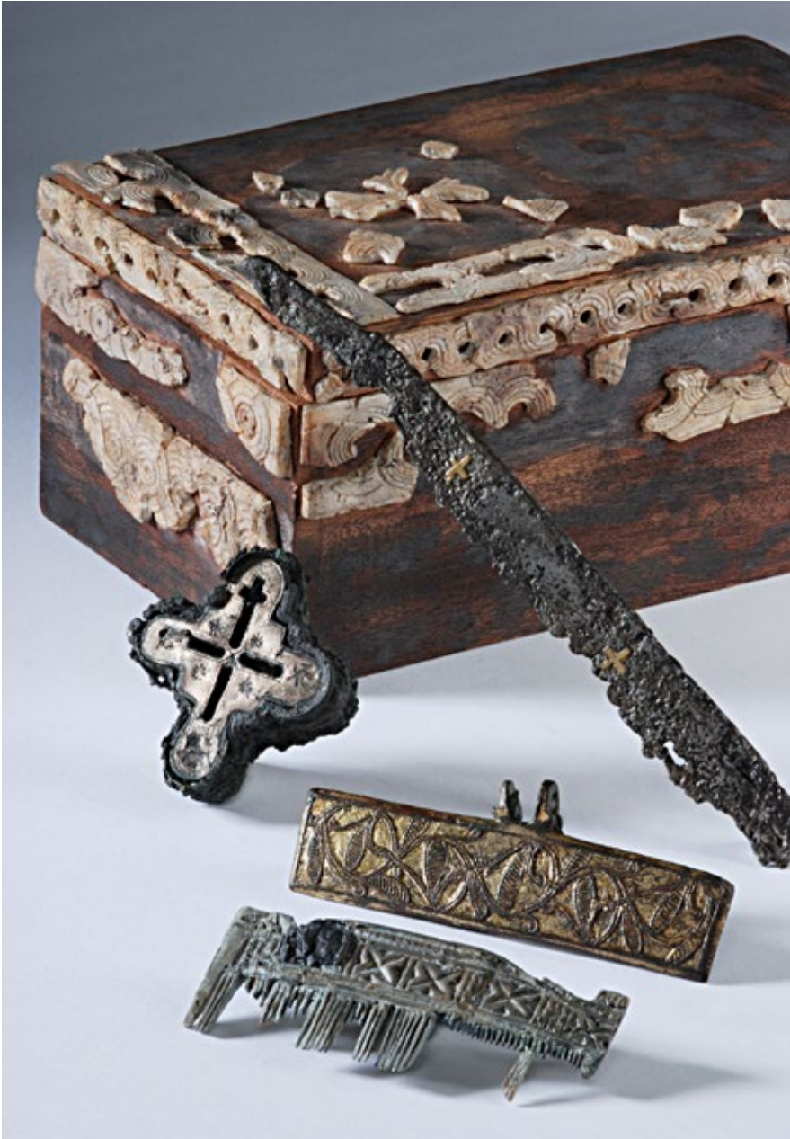
Ryc. 14. Sakralia odnalezione na Ostrowie Lednickim z końca X – początku XI wieku: skrzynka relikwiarzowa, nóż liturgiczny, stauroteka, okucie księgi liturgicznej, grzebień liturgiczny; fot. Mariola Józwickowska

Fig. 14. Religious items recovered from Ostrów Lednicki, end of the tenth – early eleventh centuries (a reliquary box, a liturgical knife, a stauroteka, a liturgical book fitting and a liturgical comb); photo Mariola Józwickowska