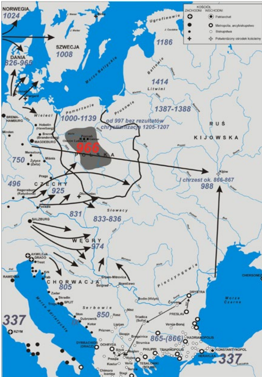
Ryc. 1. Rozprzestrzenianie się chrześcijaństwa w środkowo-wschodniej Europie od IV do XV wieku; zaznaczono daty pierwszej misji lub chrzest władcy; oprac. Andrzej M. Wyrwa, oprac. komp. Arkadiusz Tabaka, wg HISTORIA CHRZEŚCIJAŃSTWA 1999, t. 4, s. 706