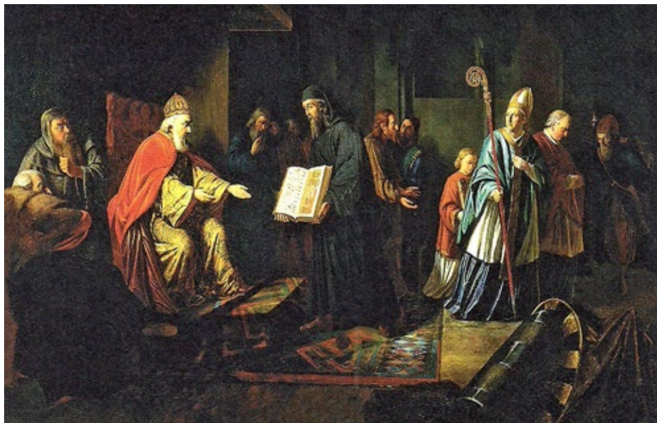
Ryc. 4. Wielki książę kijowski Włodzimierz wybiera wiarę, obraz Johanna Lebrechta Egginka z 1822 roku; za OŻÓG 2016, s. 31

Fig. 4. Prince Vladimir Chooses a Religion in 988, an 1822 painting by Johann Lebrecht Eggink; after OŻÓG 2016, p 31