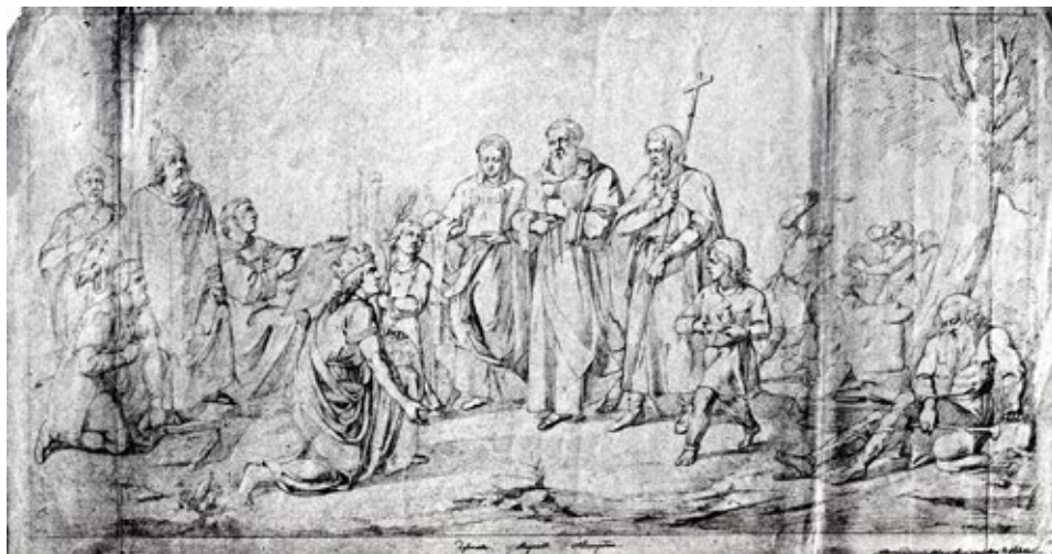
Ryc. 5. Ignacy Gierdziejewski, Chrzest Polski , 1853, Muzeum Narodowe w Warszawie; za CICIORA, WYRWA 2013, ryc. 19

Fig. 4. Prince Vladimir Chooses a Religion in 988, an 1822 painting by Johann Lebrecht Eggink; after OŻÓG 2016, p 31