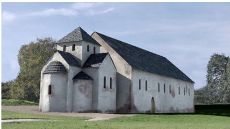
Ryc. 12. Wizualizacja kaplicy i palatium na Ostrowie Lednickim w fazie I; kadr z filmu Wyspa władców w reż. Zdzisława Cozaca Fig. 12. Visualisation of the chapel and the palace at Ostrow Lednicki. Phase I; a shot action from "The Island of Rulers" (a film directed by Zdzisław Cozac)