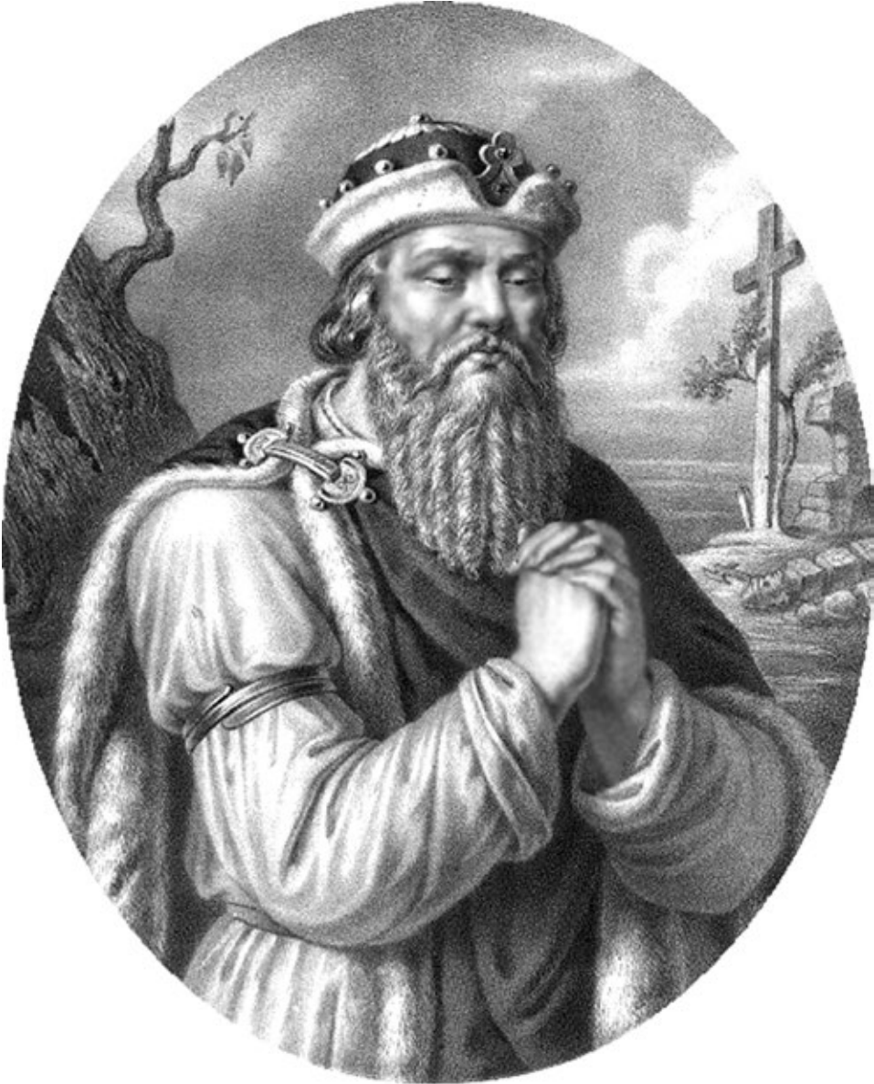
Ryc. 2. Mieszko I; wg KRÓLOWIE POLSCY 1860

Fig. 2. Mieszko I; according to KRÓLOWIE POLSCY 1860