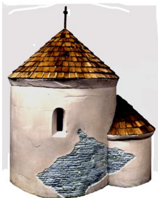
Ryc. 13. Rotunda pw. św. Piotra w Łeknie z pierwszych lat XI wieku; rekonstrukcja Jerzy Borwiński Fig. 13. Early eleventh-century St Peter rotunda church in Łekno; reconstruction Jerzy Borwiński