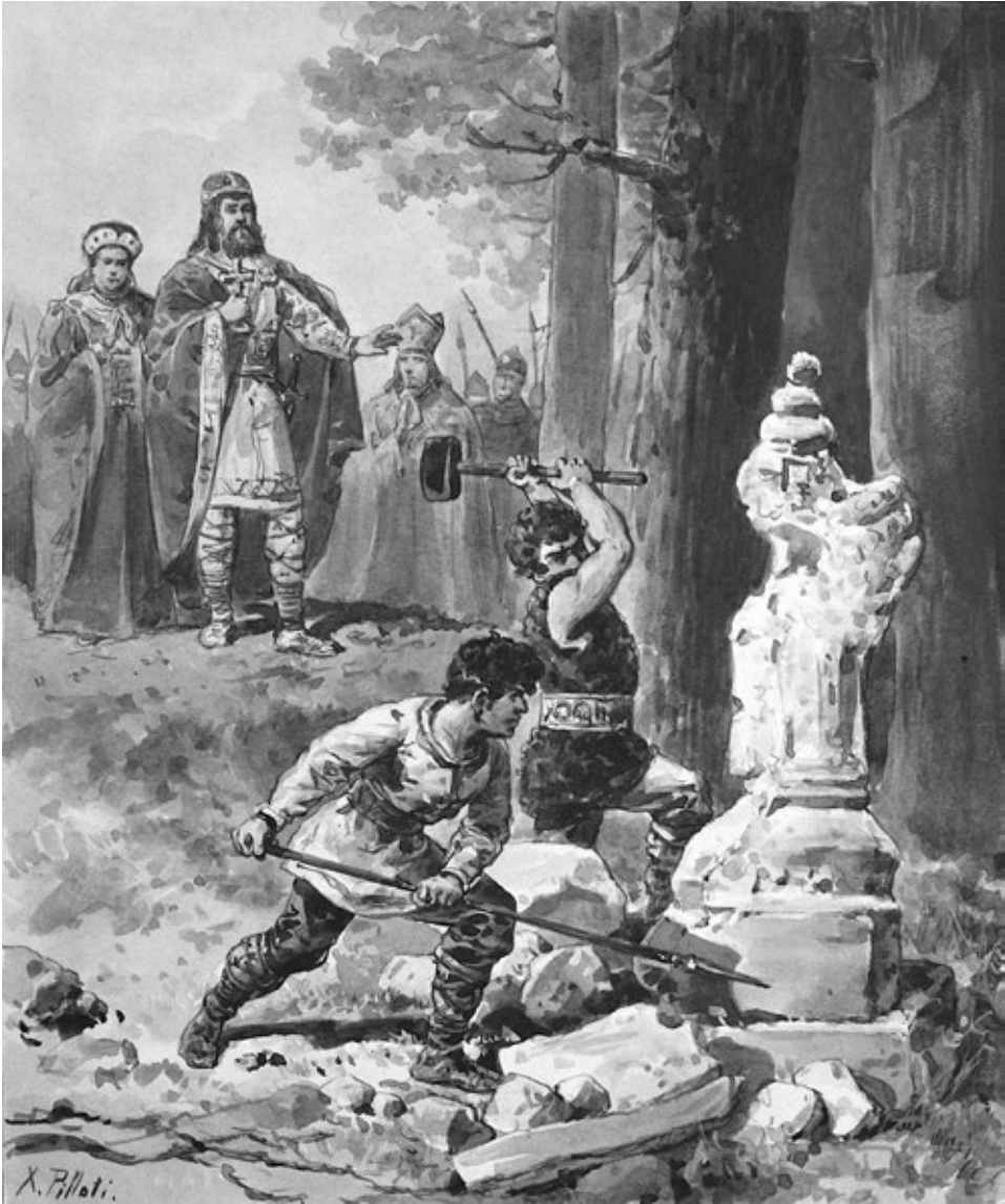
Ryc. 7. Ksawery Pillati, Niszczenie bożków , Muzeum Narodowe w Warszawie; za CICIORA, WYRWA 2013, ryc. 22

Fig. 7. Ksawery Pillati, Niszczenie bożków [The Demolition of Idols]. National Museum in Warsaw; after CICIORA, WYRWA 2013, Fig. 22