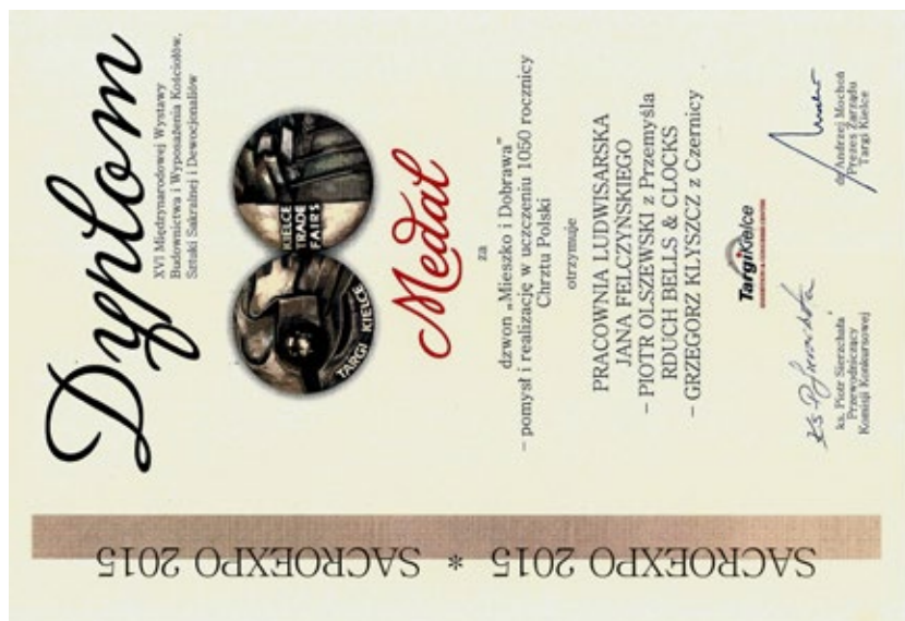
Ryc. 9. Dyplom przyznany Pracowni Ludwisarskiej Jana Felczyńskiego w Przemysłu i Dobrawa na Targach SACROEXPO 2015 w Kielcach