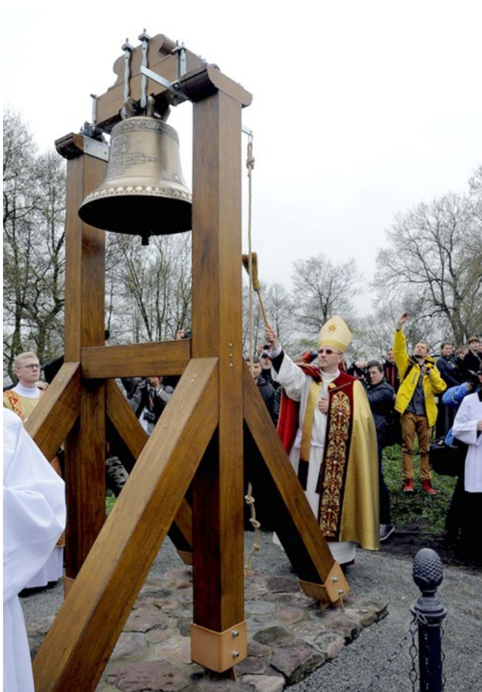
Ryc. 15. Ksiądz arcybiskup Wojciech Polak Metropolita Gnieźnieński Prymas Polski święci dzwon Mieszko i Dobrawa na Ostrowie Lednickim 14 kwietnia 2016 roku