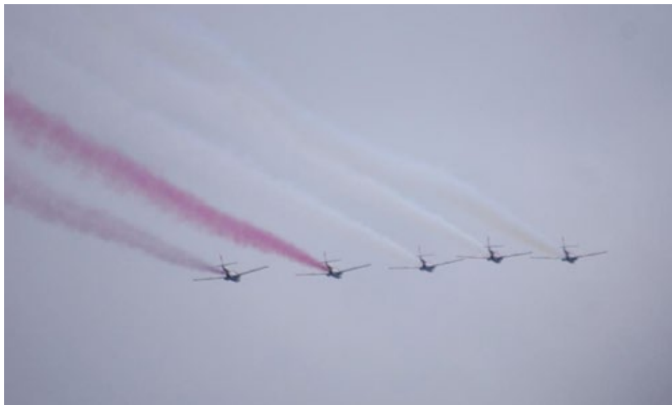
Ryc. 16. Zespół Akrobacyjny (Sił Powietrznych) „Biało-Czerwone Iskry” „rozpylający” biało czerwoną flagę nad Ostrowem Lednickim; za https://www.umww.pl/przed-nami-centralne-obchody-1050-rocznicy-chrztu-polski