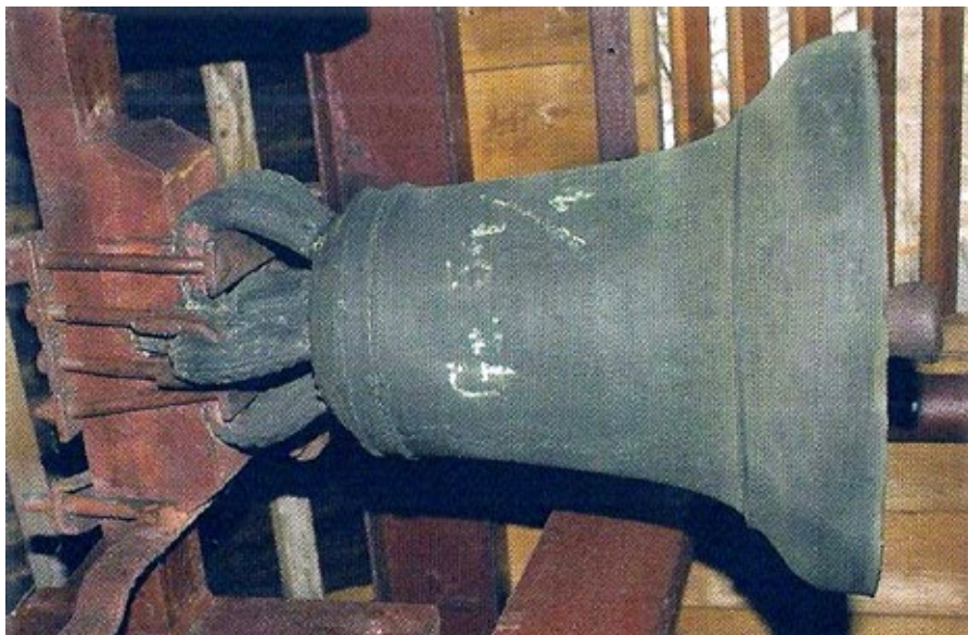
Ryc. 2. Dzwon Apostoł z Gruszowa; wg GIERLOTKA 2013, s. 30