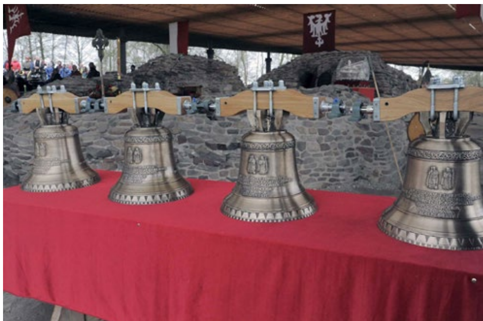
Ryc. 17. Repliki dzwonu Mieszko i Dobrawa przy kaplicy baptyzmalnej na Ostrowie Lednickim w czasie uroczystości 14 kwietnia 2016 roku