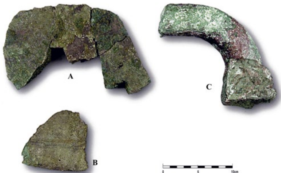
Ryc. 1. Giecz. Fragmenty czaszy dwóch dzwonów (A i B) i fragmentu korony (C); wg KURNATOWSKA 2008, s. 374

[głosząc] z obłoków prawdy Boże [...]. Ma język, ma głos, weseli się, płacze, jęczy, bo [jest] jak istota żyjąca [NOWOWIEJSKI 1893, s. 1277].