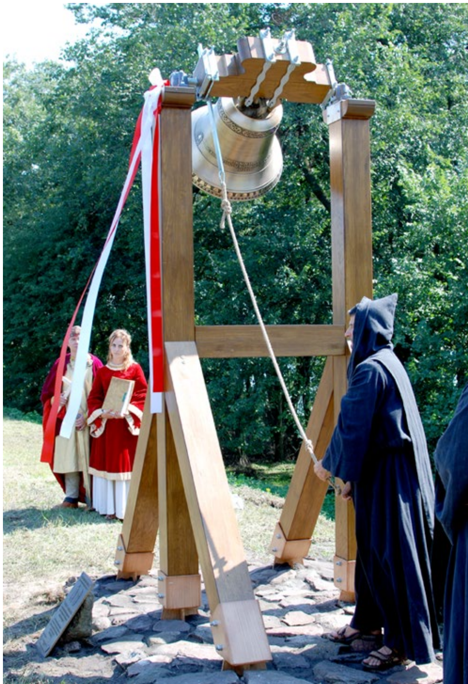
Ryc. 11. Ostrów Lednicki. Próba dźwięku dzwonu 21 sierpnia 2015 roku; fot. Mariola Józwickowska