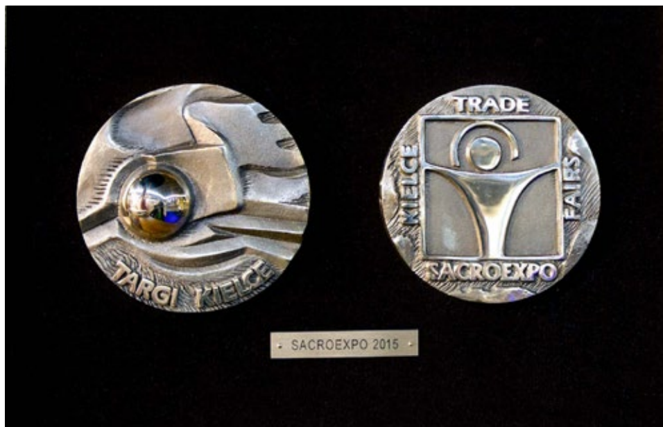
Ryc. 10. Medal przyznany Pracowni Ludwisarskiej Jana Felczyńskiego w Przemysłu za dzwon Mieszko i Dobrawa na Targach SACROEXPO 2015 w Kielcach

Pierwsza oficjalna próba dźwięku dzwonu nastąpiła 21 sierpnia 2015 roku o godz. 12 00 . Tego dnia dzwon pierwszy raz oficjalnie rozbrzmiał na Ostrowie Lednickim po swym „narodzeniu”. W czasie próby dźwięku tłem dla jego głosu była odtwarzana z płyty Bogurodzica .