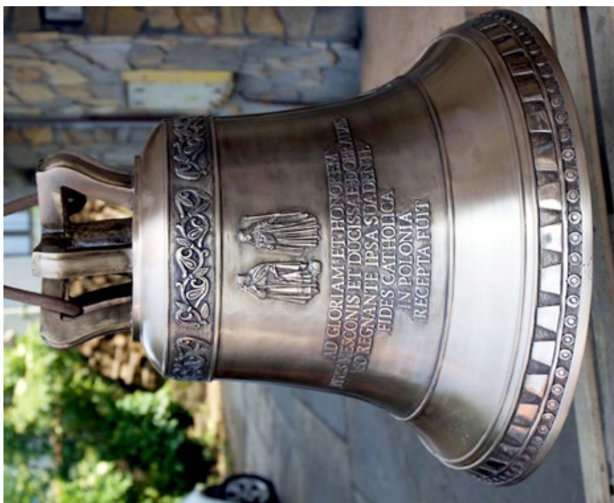
Ryc. 3. Dzwon Mieszko i Dobrawa — symbol dynastii piastowskiej; fot. Piotr Olszewski