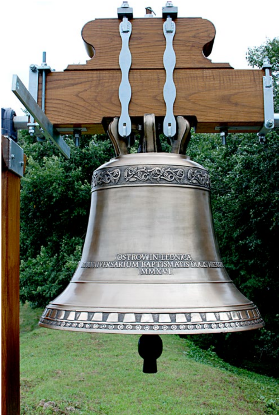
Ryc. 7. Ostrów Lednicki. Rewers dzwonu Mieszko i Dobrawa