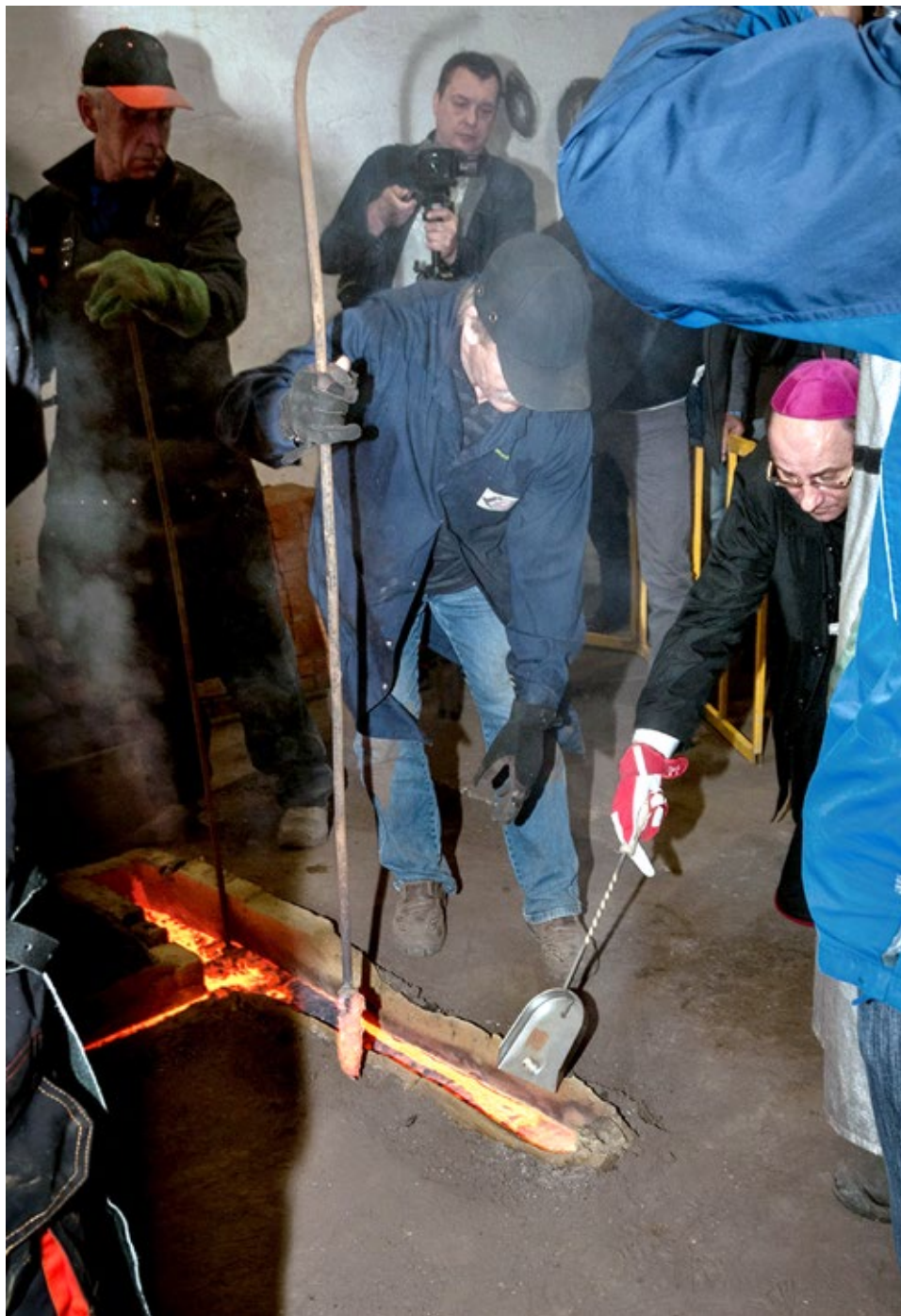
Ryc. 4. Ksiądz arcybiskup Wojciech Polak Metropolita Gnieźnieński Prymas Polski wrzuca do stopu swój pierścień biskupi