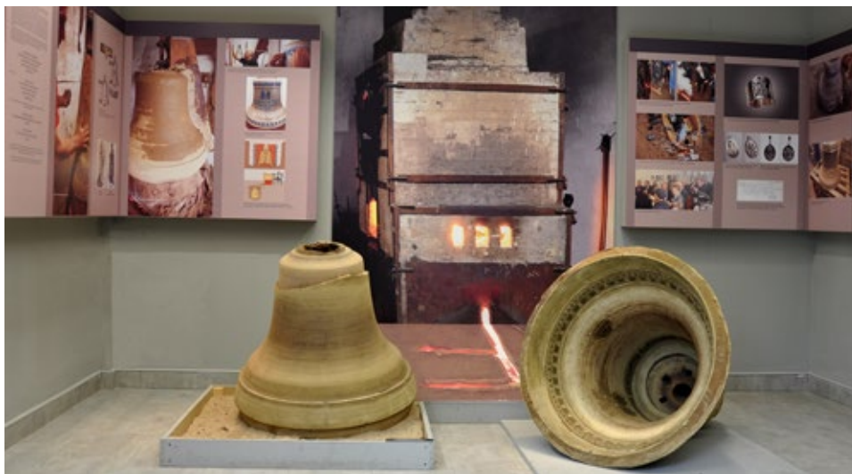
Ryc. 13. Fragment wystawy Narodziny dzwonu obrazującej powstanie dzwonu Mieszko i Dobrawa. Na pierwszym planie kopie rdzenia i dzwonu właściwego bez ornamentyki (po lewej) oraz płaszczka zewnętrznego dzwonu z negatywem ornamentacji (po prawej); fot. Andrzej Ziółkowski