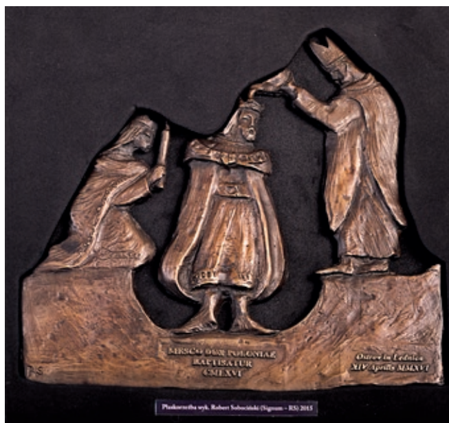
Ryc. 22. Brązowa płaskorzeźba w ozdobnym etui upamiętniająca 1050. rocznicę chrztu księcia Mieszka I i poświęcenie dzwону Mieszko i Dobrawa wykonana przez Roberta Sobocińskiego