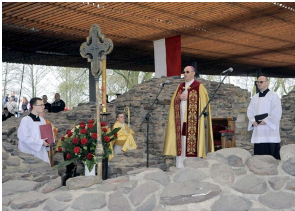
Ryc. 14. Państwowo-kościelne uroczystości jubileuszowe na Ostrowie Lednickim upamiętniające 1050. rocznicę chrztu księcia Mieszka celebrowane przez Prymasa Polski 14 kwietnia 2016 roku