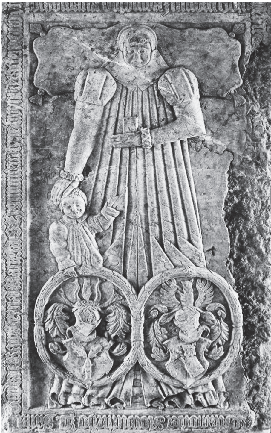
Nagrobek 1562 r.; zbiory Muzeum města Duchcova