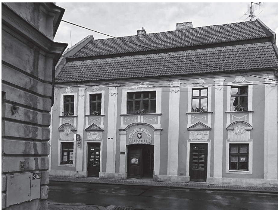
Obecna siedziba Muzeum Miasta Duchcowa