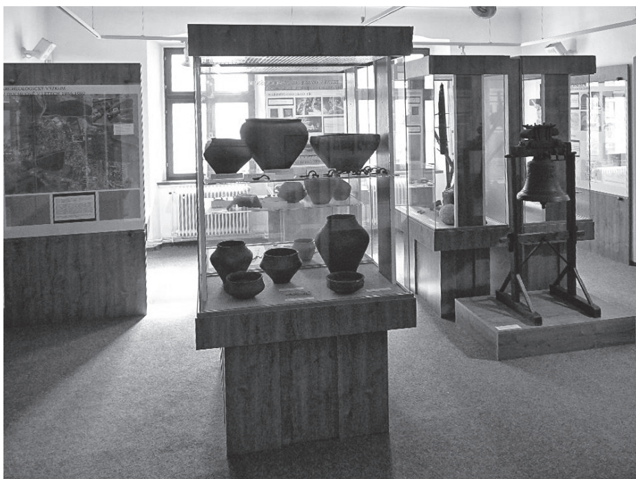
Fragment stałej wystawy o historii Duchcowa