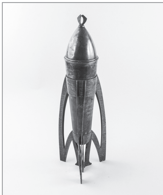
6. Puchar dla drużyny SHL Kielce za zdobycie Mistrzostwa Polski w Crossach, Polski Związek Motorowy, Kielce; 1963, nr inw. MHKi/Mat/3166

kieleckiego, radomskiego, rzeszowskiego, tarnobrzeskiego i tarnowskiego. Dodatkową nagrodą oprócz statuetki i dyplomu były m.in. zniżki na reklamy w mediach 18 .