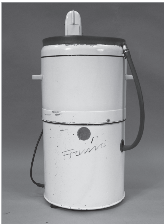
3. Pralka wirnikowa „Francia”, Kieleckie Zakłady Wyrobów Metalowych SHL; 1963, nr inw. MHKi/H/63