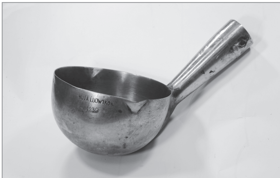
2. Czerpak chochli z wyposażenia wojskowej kuchni polowej, napisy wybite stemplem: „WOJSK. NIERDZEWNE 0,6 L HUTA LUDWIKÓW 1939”, Huta „Ludwików” w Kielcach, 1939, nr inw. MHKi/H/140