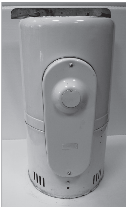
1. Obudowa pralki wirnikowej typ D („Danusia”), Kieleckie Zakłady Wyrobów Metalowych SHL; 2 poł. lat 50. XX w., nr inw. MHKi/H/1937