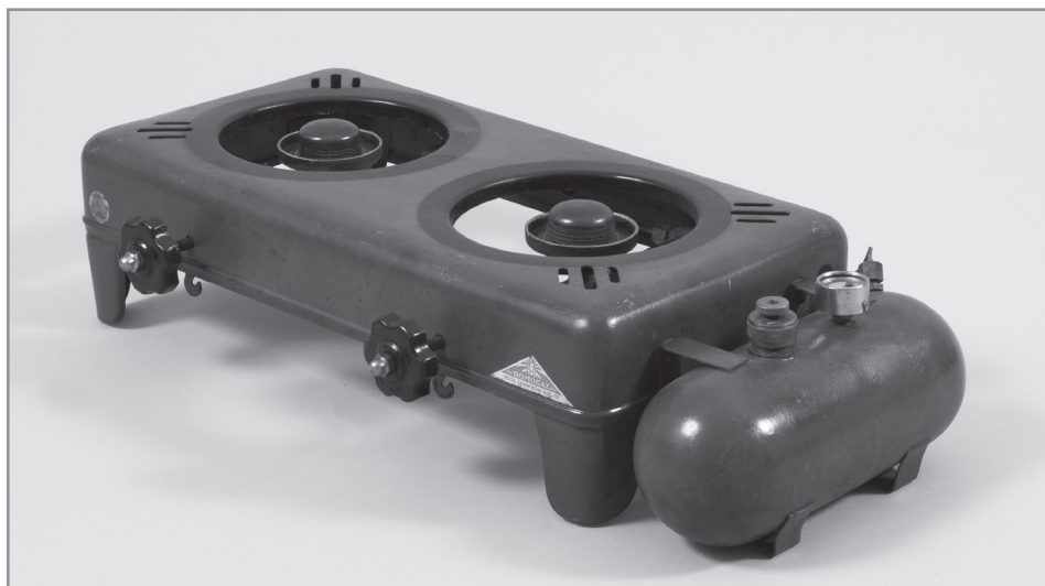
4. Kuchenka benzynowa „DOMOGAZ”, Huta Ludwików w Kielcach, lata 30. XX w., nr inw. MHKi/H/1941