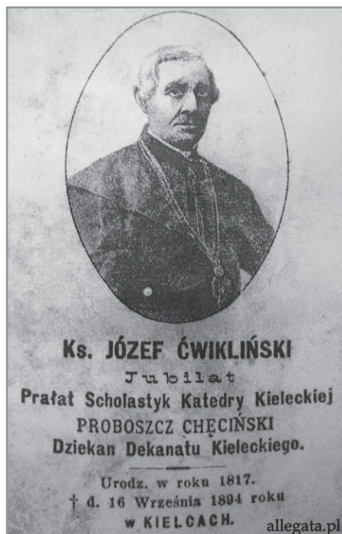
Ksiądz Józef Ćwikliński

święcenia kapłańskie, dostał nominację na wikariusza kieleckiej kolegiaty, a w 1843 r. tamże został kanonicznie zainstytuowany 9 . W 1858 r. otrzymał godność kanonika kolegiaty kaliskiej. Od 1874 r. był też kanonikiem kolegiaty kieleckiej, a później jej kanonikiem honorowym i prałatem. Został również dziekanem kieleckim, następnie proboszczem parafii w Chęcinach 10 .