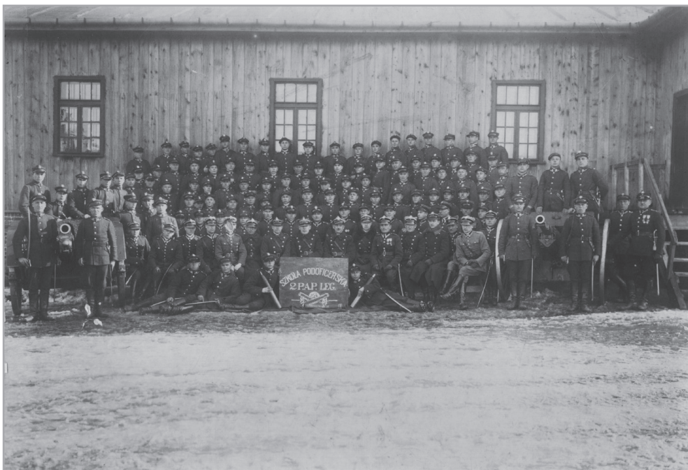
Il. 9. Słuchacze i kadra szkoły podoficerskiej 2 PAP Leg. w koszarach na Kawetczyźnie, Kielce, 1931 r.