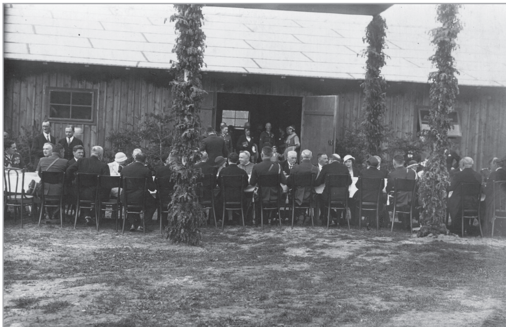
Il. 3. Uroczysty poczęstunek w czasie wizyty Prezydenta RP Ignacego Mościckiego w koszarach 2 PAL Leg., Kielce, 12 czerwca 1933 r.