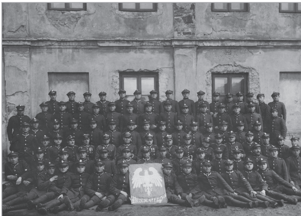
Il. 5. 2 kompania karabinów maszynowych 4 PP Leg. w Koszarach przy ul. Prostej, Kielce, 1928 r.