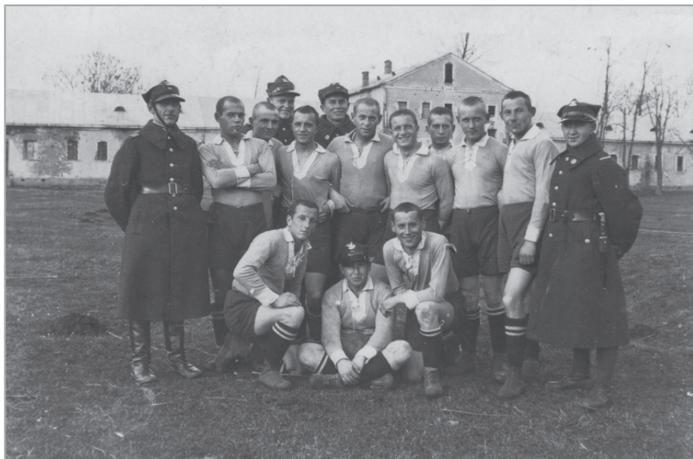
Il. 14. Drużyna piłkarska Wojskowego Klubu Sportowego „Czwartak”, Gródek Jagielloński, 1929–1933