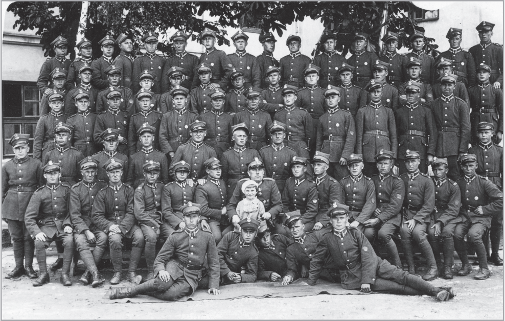
Il. 19. Kompania ciężkich karabinów maszynowych 4 PP Leg., Kielce, koniec lat dwudziestych XX w.