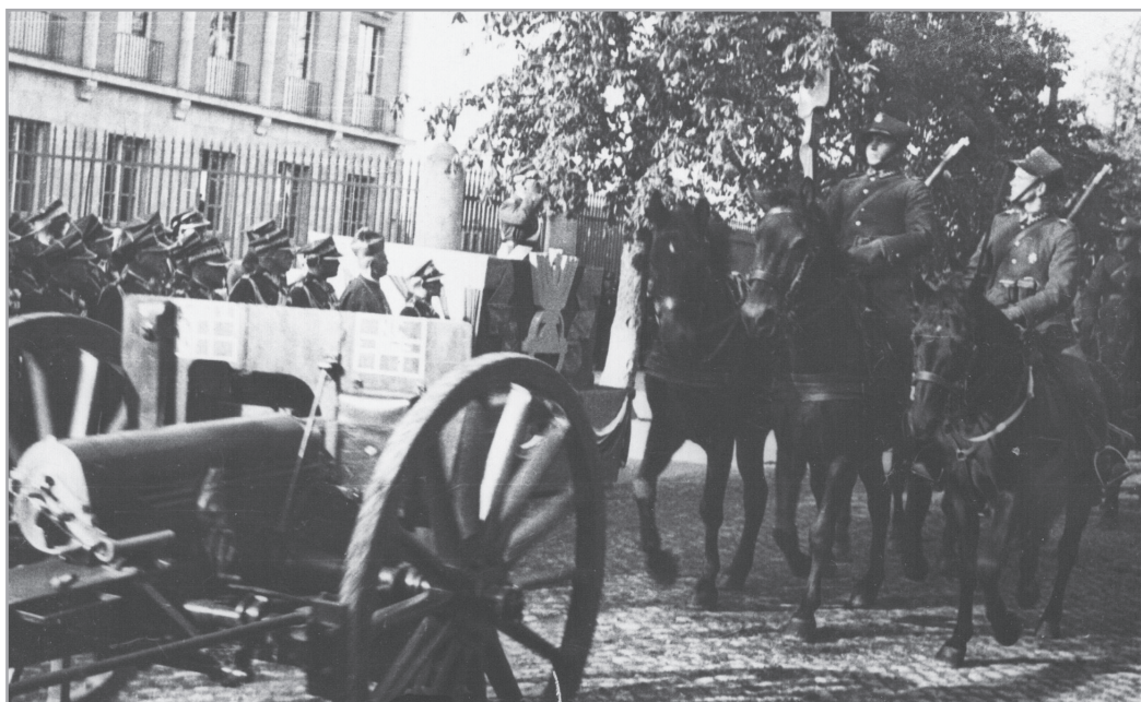
Il. 2. Artylerzyści 2 PAL Leg. defilujący przed marsz. Edwardem Rydzem-Śmigłym, Kielce, 16 października 1937 r.