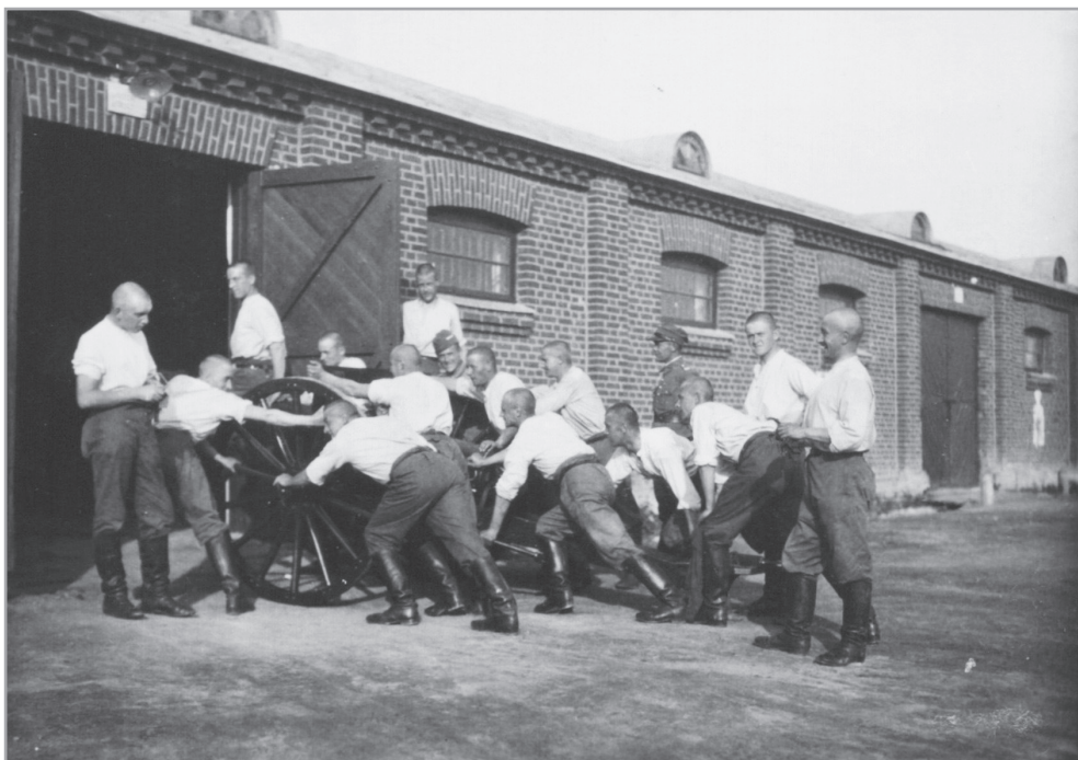
Il. 10. Żołnierze 2 PAL Leg. wtaczający armatę polową Schneider wz.1897 kal. 75 mm do budynku działowni na terenie koszar na Stadionie, Kielce, po 1936 r.