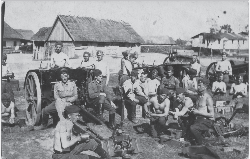
Il. 16. Obsługa haubic wz.14/19 kal. 100 mm z 2 PAL Leg. podczas odpoczynku po strzelaniu poligonowym, Niwki Daleszyckie