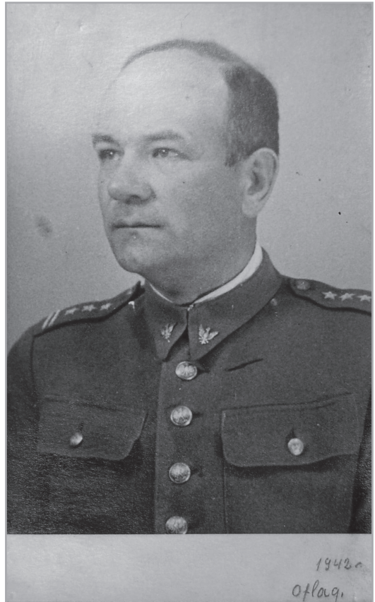
Il. 20. Płk Antoni Wiktor Staich—dowódca piechoty dywizyjnej (od 8 września 1939 r. dowodzący całością sił dywizji) 2 DP Leg., Oflag II C Woldenberg, 1942 r.