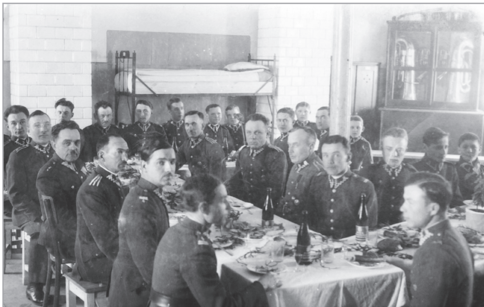
Il. 7. Żołnierze 4 PP Leg. podczas wigilijnego posiłku w koszarach na Bukówce, Kielce, 24 grudnia 1930 r.