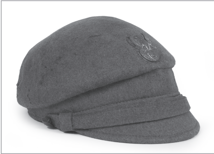
Il. 6. Czapka polowa żołnierza I Brygady Legionów Polskich, 1916 r., nr inw. MHKi/H/2096