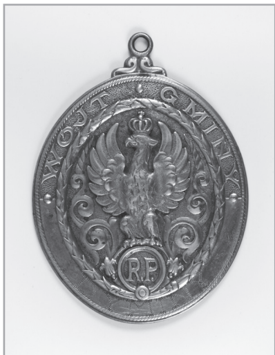
Il. 4. Oznaka wójta gminy Dyminy, wytw. Pracownia Brązownicza Braci Łopieńskich, Warszawa, lata 20. XX w., nr inw. MHKi/H/2076