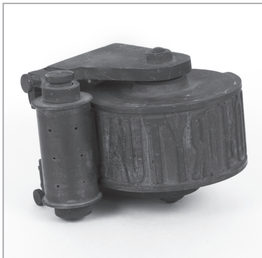
Il. 5. Pieczęć do oznaczania mięsa z uboju rytualnego, po 1936 r., nr inw. MHKi/H/2090

Z 1945 r. pochodzi negatyw na szkle przedstawiający radziecki czołg T-34 stojący na Krakowskiej Rogatce. Kolejnych 10 fotografii ukazuje składy drużyn piłkarskich rozgrywających w Kielcach spotkania w maju 1945 r.: m.in. klubów „Społem”, „Kolejowiec”, „Związku Walki Młodych” i Wojskowego Klubu Sportowego „Szturmowiec”.