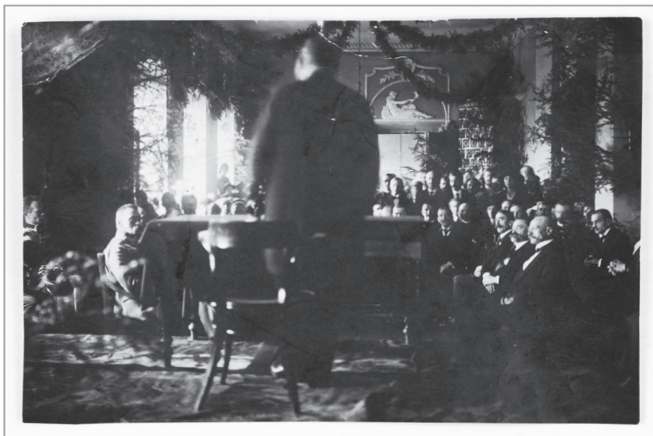
Il. 3. Józef Piłsudski i radni miejscy w momencie nadania Marszałkowi honorowego obywatelstwa Kielc, 1921 r., nr inw. MHKi/H/2123