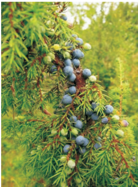
Ryc. 1. Szyszkojagody jałowca pospolitego ( Juniperus communis L.).

bardzo różnych siedliskach — od bagien, poprzez lasy, po murawy, odłogi i tereny skaliste. Jest jedynym drzewem iglastym Arktyki. Takson Juniperus , zadomowiony od ponad 50 milionów lat na półkuli północnej, zarówno w Eurazji, jak i Ameryce, posiada 70 gatunków i należy do roślin istic długowiecznych, dożywających nawet 3500 lat 14 .