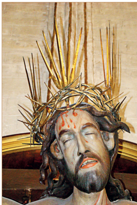
Il. 3 Fragment rzeźby Chrystusa Ukrzyżowanego z pocz. XV w. w katedrze Narodzenia Najświętszej Maryi Panny w Sandomierzu