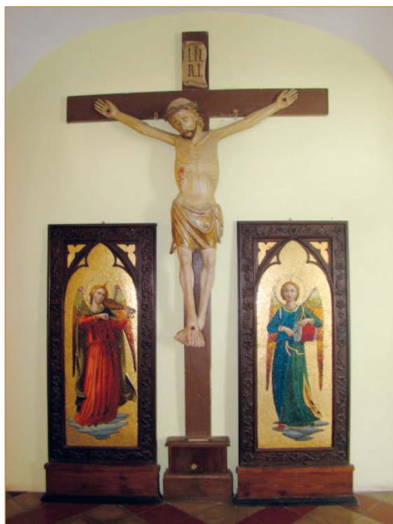
Il. 6 Krucyfiks z 1. ćw. XV w. w klasztorze Ojców Cystersów w Szczyrzycu (fot. Katarzyna Pająk).