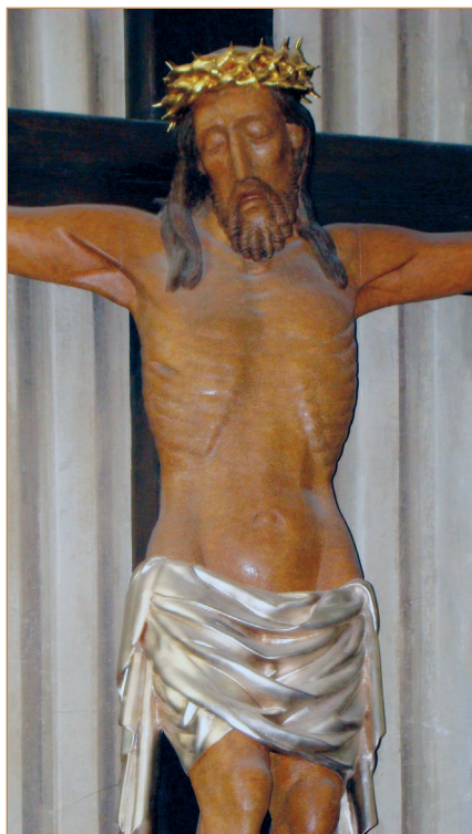
Il. 7 Fragment rzeźby Chrystusa Ukrzyżowanego z pocz. XV w. w kolegiacie św. Marcina z Tours w Opatowie.