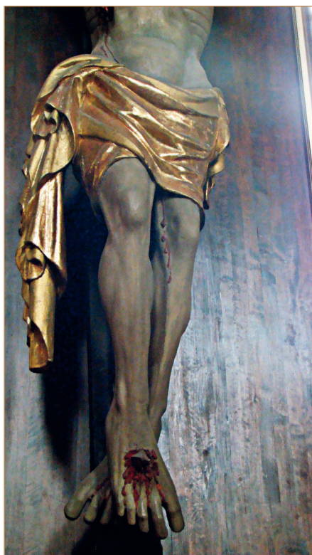
Il. 4 Fragment rzeźby Chrystusa Ukrzyżowanego z pocz. XV w. w katedrze Narodzenia Najświętszej Maryi Panny w Sandomierzu