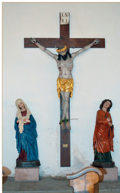
Il. 8 Krucyfiks z pocz. XV w. w konkatedrze Świętej Trójcy w Chełmży. (fot. Katarzyna Pająk).