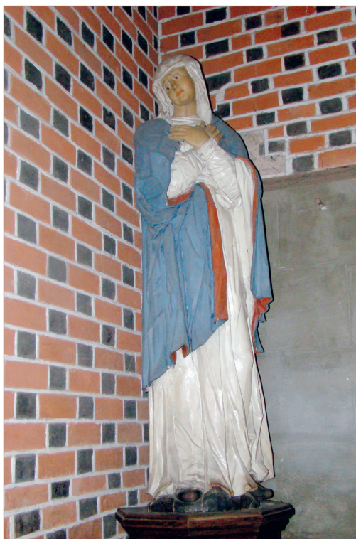
Il. 2 Figura Matki Bożej z XV w., w katedrze Narodzenia Najświętszej Maryi Panny w Sandomierzu