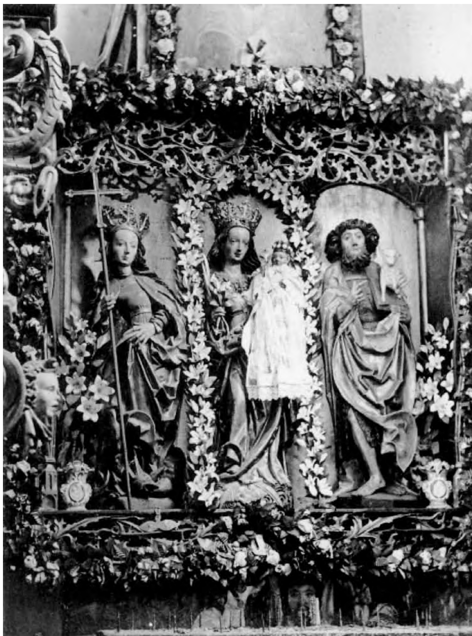
Środkowa część ołtarza gotyckiego w kościele w Pierzchałach sprzed 1945 r., w: A. Boetticher, Die Bau- und Kunstdenkmäler in Ermland, Königsberg 1894, tabl. XI.