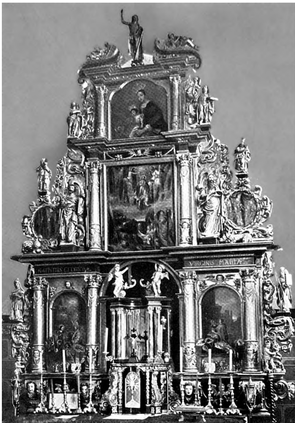
Barokowy ołtarz kościoła w Pierzchałach sprzed 1945 r. według A. Ulbrich, w: Geschichte der Bildhauerkunst in Ostpreussen, Königsberg 1926–1929, tabl. 15.