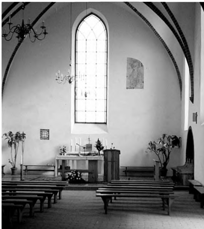
Prezbiterium odbudowanego kościoła w Pierzchałach

w górnej z drewna, z dachem pokrytym ceglana dachówką. W tym układzie architektonicznym odbudowano kościół obecnie.