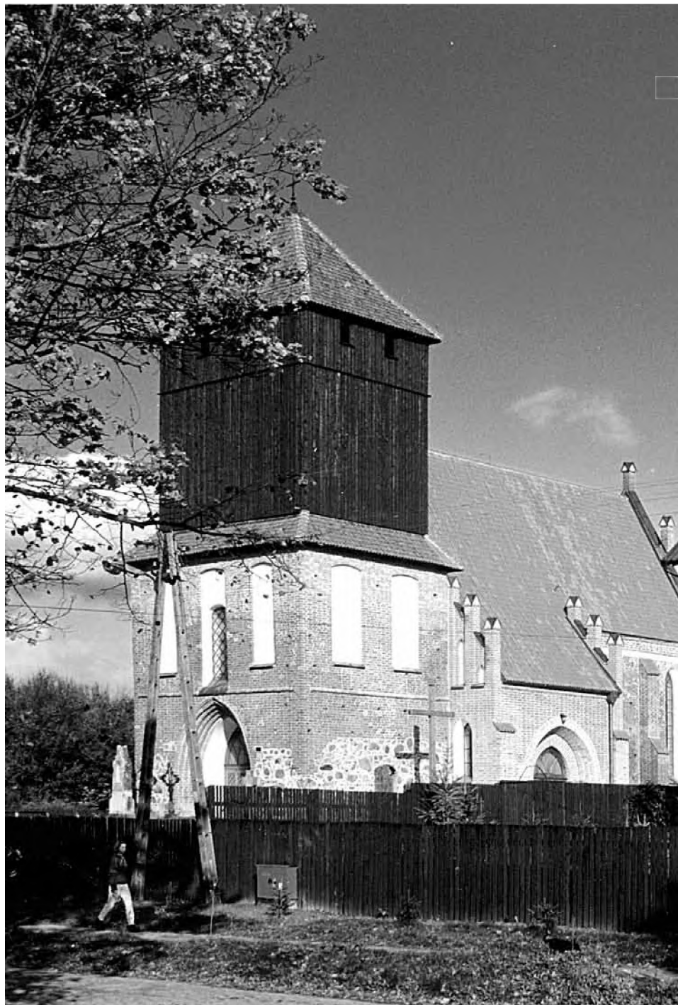
Odbudowany kościół w Pierzchałach