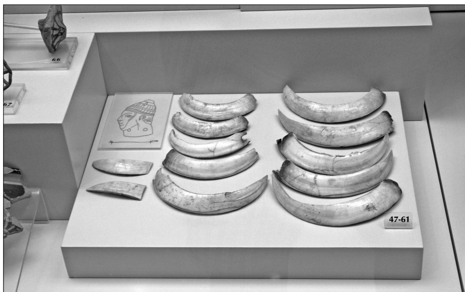
Fot. 3. Kły dzika. Muzeum w Mykenach (fot. R. Dzedzic)

Myśliwi od czasów najdawniejszych pozostawiali „pamiątki” z upolowanych zwierząt, które miały odzwierciedlać ich sprawność czy siłę. Dla tych „pamiątek” przyjęto greckie określenie tropaion i dzisiaj w większości języków używa się określenia trofeum. Takie zachowania występowały we wszystkich kulturach cywilizacyjnych i trwają ciągle. Jedno z najstarszych trofeów znajduje się w muzeum w Mykenach (Grecja) i pochodzi sprzed około 3000 lat; są to kły dzika (fot. 3). Pamiątkami z upolowanych zwierząt