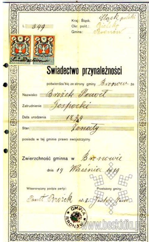
Fot. 2. Świadectwo przynależności Pawła Brożka do gminy Bronów z 14 września 1919 r. 43

Wydania świadectwa przynależności nie można było odmówić nikomu, kto posiadał prawo swojszczyzny. Dokument taki tracił ważność jedynie w sytuacji, gdy gmina była w stanie udowodnić jego właścicielowi, że w czasie kiedy go wystawiono, posiadał prawo swojszczyzny w innej gminie 44 .