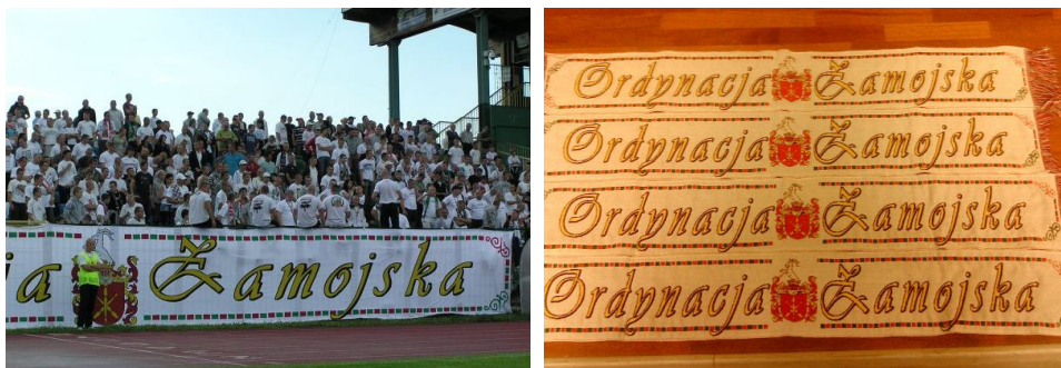
Ryc. 3. Transparent i szaliki kibiców Hetmana Zamość. Ordynacja Zamojska i jej symbole (herb Zamojskich) jako elementy budowania tożsamości kibiców

W przypadku dużej części największych posiadłości feudalnych można zauważyć rozwój silnej tożsamości lokalnej i regionalnej, częstokroć wzmacnianej odrębnościami kulturowymi. Istnienie Ordynacji Zamojskiej miało niewątpliwie istotny wpływ na ukształtowanie się silnego, obserwowanego do dziś, regionalizmu zamojskiego (Reder 1983, ryc. 3). Odrębność mieszkańców Ordynacji zauważali ich sąsiedzi, nazywając ich „Ordynatami” (podobnie jak mieszkańców Księstwa Łowickiego nazywano „Książakami”).