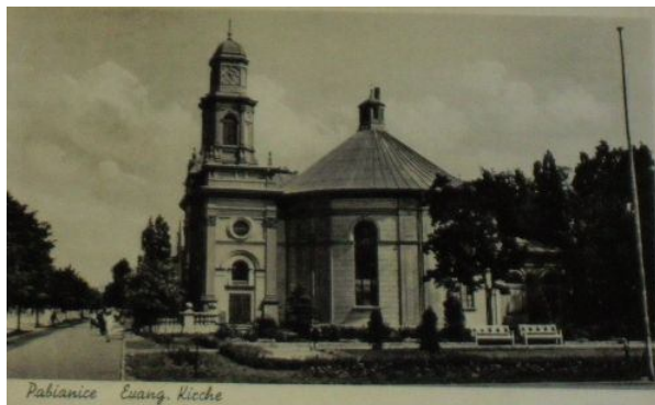
Ryc. 2. Parafia ewangelicka na pocztówce z początku XX w.

uroczyste poświęcenie świątyni. W latach 1875–1876, dzięki staraniom pastora Wilhelma Zimmera, w świątyni dokonano przebudowy, po której mogła już pomieścić blisko 1000 wiernych (ryc. 2). Dobudowano wówczas drugi chór, fronton zwieńczono figurami apostołów Piotra i Pawła (ryc. 3). Wybudowano również wieżę kościelną. W 1926 r., na 100-lecie parafii ewangelickiej, świątynia została gruntownie odrestaurowana, ponadto kościołowi ofiarowano trzy dzwony ( Parafia Ewangelicko... 2012).