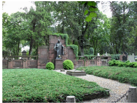
Ryc. 5. Kwaterna cmentarna rodziny Enderów

W 1852 r., w wyniku szalejącej epidemii cholery, cmentarz ten całkowicie się wypełnił, co spowodowało konieczność pozyskania nowych gruntów na cele grzebalne. Parafia ewangelicka pozyskała dodatkowe 4900 łokci ziemi (czyli ok. 2917 m 2 ) w wieczystą dzierżawę od katolickiej parafii św. Mateusza.