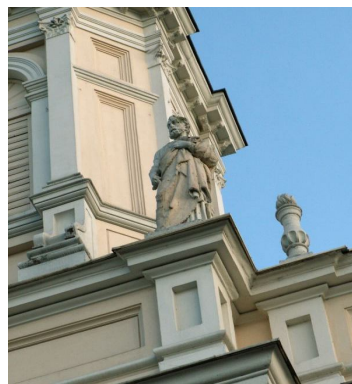
Ryc. 3. Figura jednego z apostołów (patrona Kościoła) na frontonie świątyni