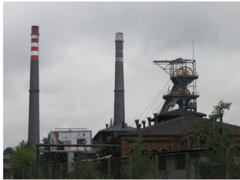
Ryc. 7. Szyb Pułaski