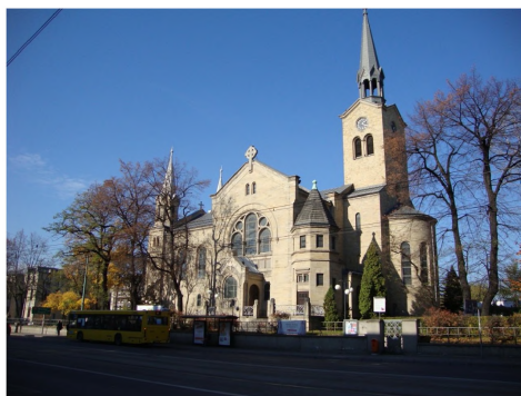
Ryc. 3. Kościół ewangelicko-augusburski przy ul. Warszawskiej Źródło: fotografia autorki (2013)