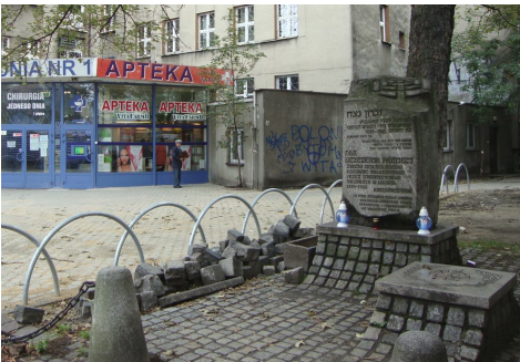
Ryc. 12. Tablica pamiątkowa w miejscu Synagogi Wielkiej w Katowicach oraz zachowany budynek domu modlitewnego przy synagodze – obecnie przychodnia zdrowia