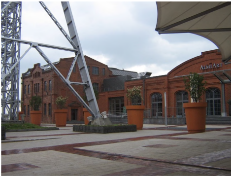
Ryc. 6. Elementy dawnej zabudowy przemysłowej kopalni węgla kamiennego Gottwald na terenie Silesia City Center

Najslabiej zachowaną i najbardziej narażoną na całkowitą likwidację grupą są elementy zabudowy hut, kopalń czy fabryk. W związku z restrukturyzacją przemysłu i rewitalizacją zdegradowanych terenów poprzemysłowych systematycznie znikają one z przestrzeni miasta. Do zachowanych można zaliczyć kilka zabytkowych budynków, zlokalizowanych na terenie dawnej kopalni Gottwald, gdzie mieści się Silesia City Center (ryc. 6), czy na terenie dawnej kopalni Katowice, gdzie mieści się Nowe Muzeum Śląskie, oraz budynki czynnej jeszcze kopalni Wieczorek (ryc. 7) (Chmielewska 2010). Zachowana, aczkolwiek w bardzo złym stanie, jest także zabudowa huty Uthemanna w Szopienicach. Dla kontrastu, w dobrym stanie znajduje się odrestaurowana zabudowa szopienickiego browaru Mokrskich.