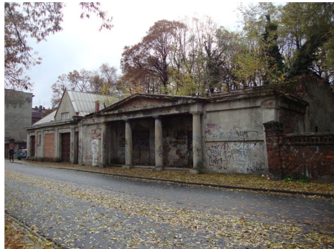
Ryc. 11. Dom pogrzebowy przy cmentarzu żydowskim w Katowicach