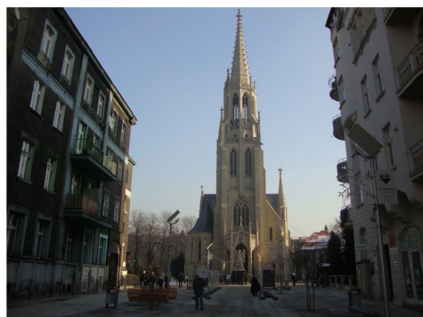
Ryc. 4. Kościół katolicki przy ul. Mariackiej