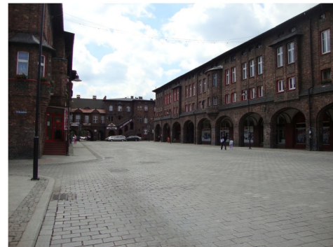
Ryc. 9. Fragment zabudowy osiedla patronackiego Nikiszowiec