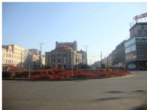
Ryc. 2. Teatr Śląski im. S. Wyspiańskiego