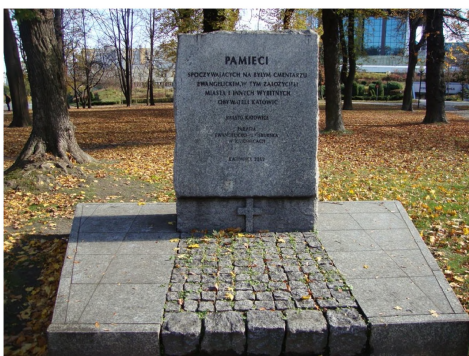
Ryc. 5. Tablica pamiątkowa w miejscu dawnego cmentarza ewangelickiego przy ul. Damrota

Dziedzictwo przemysłowe pozostałe po działalności „wielkich przemysłowców” jest dla odmiany możliwe do znalezienia w różnych zakątkach współczesnych Katowic, wszędzie tam, gdzie prowadzili oni swoją działalność. Przede wszystkim należy wyróżnić tu trzy grupy obiektów: zabudowę zakładów przemysłowych, osiedla i kolonie patronackie oraz rezydencje właścicieli zakładów przemysłowych.