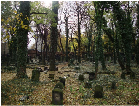
Ryc. 10. Kirkut przy ul. Kozielskiej Źródło: fotografia autorki (2013)

litwy przy synagodze jest dziś przychodnia zdrowia (ryc. 12). Do dziś przetrwał również budynek łaźni rytualnej, sąsiadujący z Wielką Synagogą, w którym obecnie mieści się bank (Dudała, Dziwoki 2004, Suchacka, Szczepański, Ślęzak-Tazbir 2007).