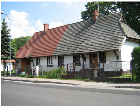
Ryc. 8. Fragment pierwotnej zabudowy mieszkaniowej osiedla patronackiego Giszowiec