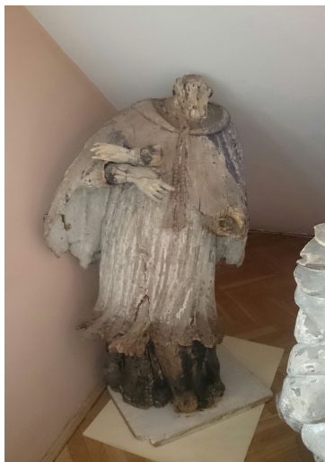
Ryc. 20. Rzeźba św. Jana Nepomucena w Muzeum Filumenistycznym w Bystrzycy Kłodzkiej