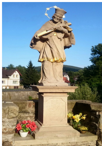
Ryc. 13. Pomnik Jana Nepomucena w Łądku-Zdroju po renowacji