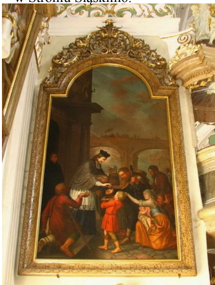
Ryc. 22. Obraz przedstawiający Jana Nepomucena w kościele pw. Narodzenia NMP w Łądku-Zdroju