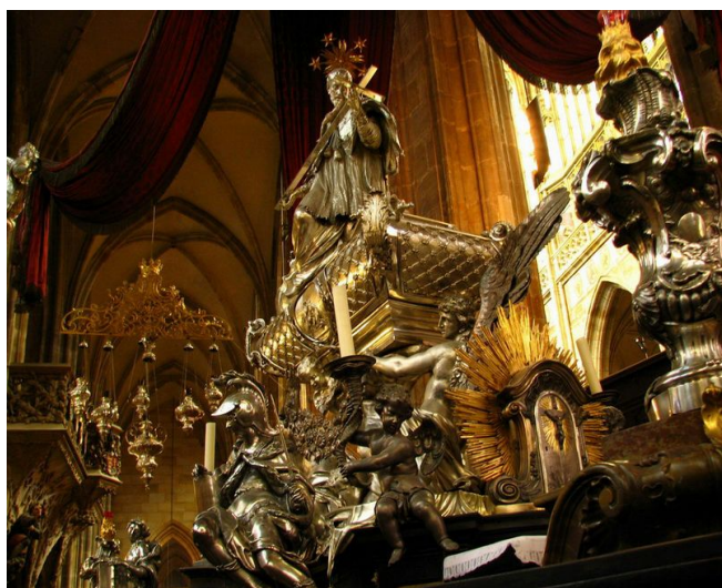
Ryc. 1. Nagrobek św. Jana Nepomucena w praskiej katedrze św. św. Wita, Waclawa i Wojciecha