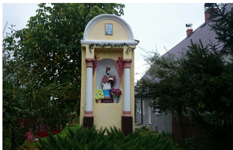
św. Jana Nepomucena w Starkowie

W wielu świątyniach uwagę zwracają boczne ołtarze upamiętniające św. Jana Nepomucena. Są to ołtarze w kościele Matki Boskiej Różańcowej w Kłodzku, kościele pw. Józefa Oblubieńca w Bolesławowie (ryc. 8), w bazylice Nawiedzenia NMP Wambierzycach (ryc. 9), kościele pw. św. Mikołaja w Nowej Rudzie.