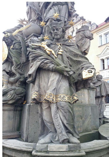
Ryc. 11. Pomnik Jana Nepomucena na rynku w Bystrzycy Kłodzkiej