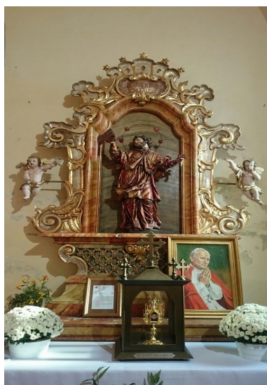
Ryc. 8. Ołtarz boczny w Bolesławowie

W wielu świątyniach uwagę zwracają boczne ołtarze upamiętniające św. Jana Nepomucena. Są to ołtarze w kościele Matki Boskiej Różańcowej w Kłodzku, kościele pw. Józefa Oblubieńca w Bolesławowie (ryc. 8), w bazylice Nawiedzenia NMP Wambierzycach (ryc. 9), kościele pw. św. Mikołaja w Nowej Rudzie.