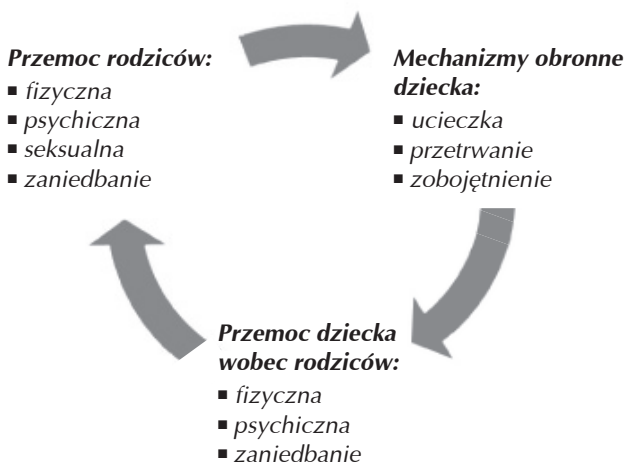
Schemat 2. Przemocowe interakcje rodzinne

Jak widać, mobbing rodzinny niesie ze sobą określone skutki w postawach dziecka. Drugi schemat pokazuje określone zachowania rodziców i dzieci w kontekście przemocy. W konsekwencji w wielu przypadkach dochodzi do powielenia pewnych zachowań także w szkole.