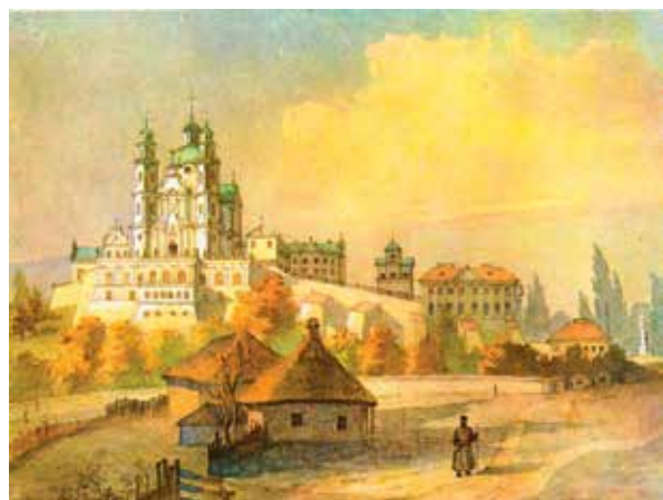
Il. 4. Taras Szewczenko, Widok ławry Poczaiewskiej od południa , 1846, akwarela wykonana w ramach inwentaryzacji zabytków prowadzonej przez Komisję Archeograficzną w Kijowie, wg Степовик (1986: il. 41)