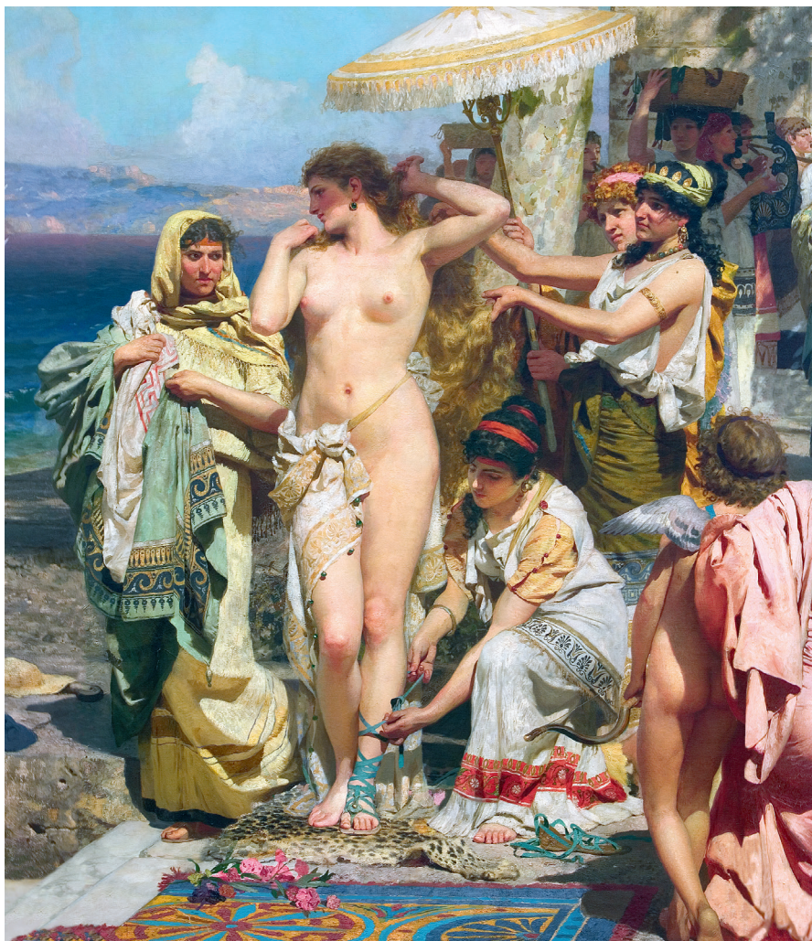
Илл. 1. Фрина на празднике Посейдона в Элевзине, фрагмент, 1889, холст, масло, 390 × 763,5 см, Государственный Русский музей, Санкт-Петербург