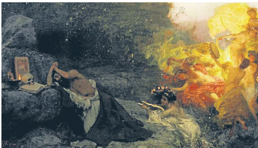
Илл. 6. Испытание Святого Иеронима, 1885–1886, холст, масло, 80 × 178 см, частное собрание

ет к общим местам академической рецептуры. Картина производит впечатление большого декоративного панно. Неслучайно Фрина стала популярной темой любимой забавы второй половины XIX века – «живых картин». Она сама своего рода «живая картина» – актеры, задрапированные в туники и тоги, приняли красивые позы по указу художника-режиссера и замерли.