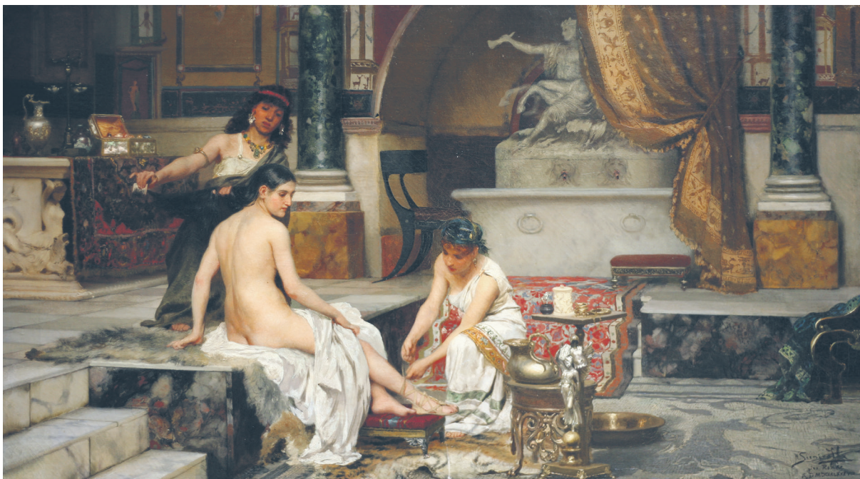
Илл. 5. Помпейская баня (После ванны), 1888, холст, масло, 45 × 80,5 см, частное собрание