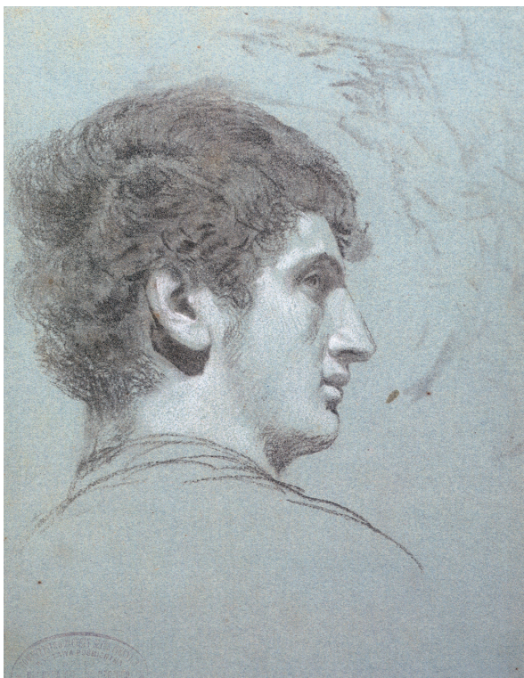
Илл. 3. Голова юноши в профиль, этюд к картине Фрина на празднике Посейдона в Элевзине , ок. 1889, бумага, графический карандаш, 37 × 26 см, Пензенская областная картинная галерея им. К. А. Савицкого