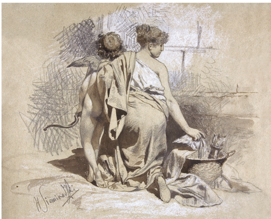
Илл. 2. Девушка с Амуром, этюд к картине Фрина на празднике Посейдона в Элевзине, ок. 1889, бумага, графический карандаш, белила, 22,3 × 28,2 см, Национальный музей в Кракове