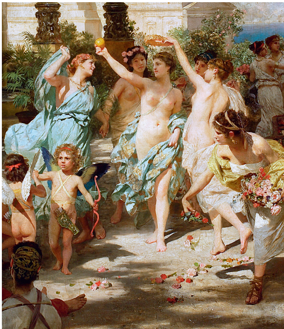
Илл. 7. Суд Париса, фрагмент, 1892, холст, масло, 99 × 227 см, Национальный музей в Варшаве

Санкт-Петербургской Академии художеств, где также экспонировались четыре другие работы художника – Перед купаньем , У фонтана , По примеру богов и Искушение Святого Иеронима (илл. 5–6). Выставка Семирадского в Академии пользовалась большим успехом, ее посетило более 30000 человек. Для эффектной подачи произведений и привлечения публики Семирадский прибег к ряду экспозиционных ухищрений: «Все окна рафаэлевской залы наглухо задрапированы плотной черной материей [...]. Перед картиной [...] наверху установлены Яблочковым четыре электрические лампы, также прикрытые. В обширном зале полумрак, а сама Фрина , расположенная в глубине его, эффектно освещается электричеством». 15