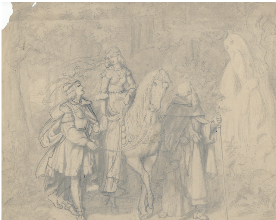
Илл. 10. Ю. Деринг, Ундина , эскиз картины (1842–1843), бумага, карандаш, НБЛ, инв. R IW-1/89–14