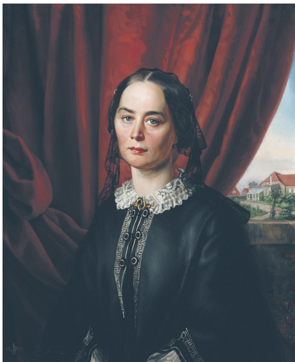
Илл. 3. Ю. Деринг, Портрет графини Марии Рачиньской ( Gräfin Marie Freiin Lüdinghausen gen. Wolff , 1823–1899), 1863, холст, масло, 77 × 63,5 см, НМП, инв. FR 644

охотничьем костюме с ягдташем и ружьем». 6 Следовательно, двойной портрет – это Братья Роберт и Карл Грошевские (илл. 4). Кроме того, известно, что Деринг уже с сороковых годов повседневно носил очки, а мужчины на картине – без очков.