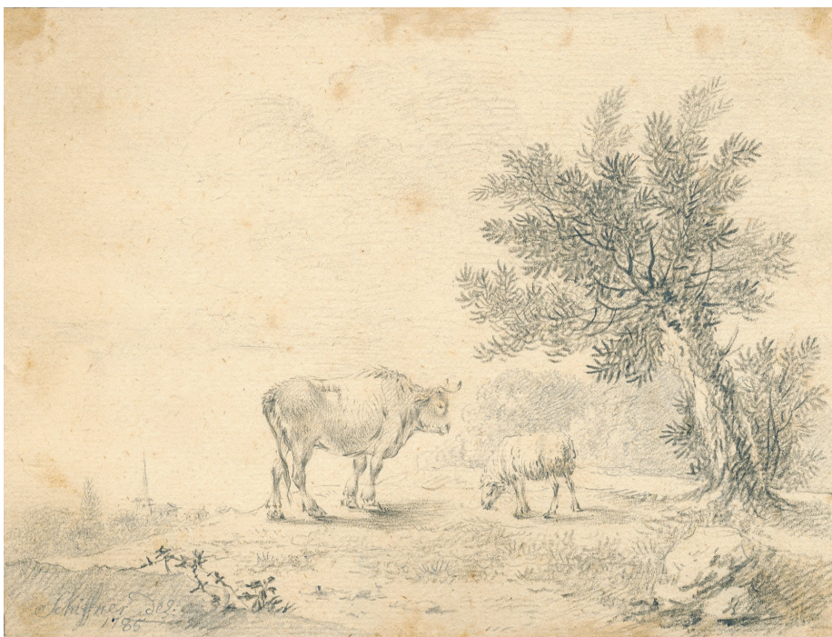
Илл. 6. Г. Шифнер, Этюд с коровой и овцой, II , 1785, бумага, карандаш, частная коллекция в Риге

в местечке Рожново (недалеко от города Оборники – Деринг это расстояние пешком проходил за один час). Приезд в Рожново был определен рядом обстоятельств. Во-первых – это, конечно, работа над заказными портретами, 8 но Деринг имел и второй, личный и очень существенный