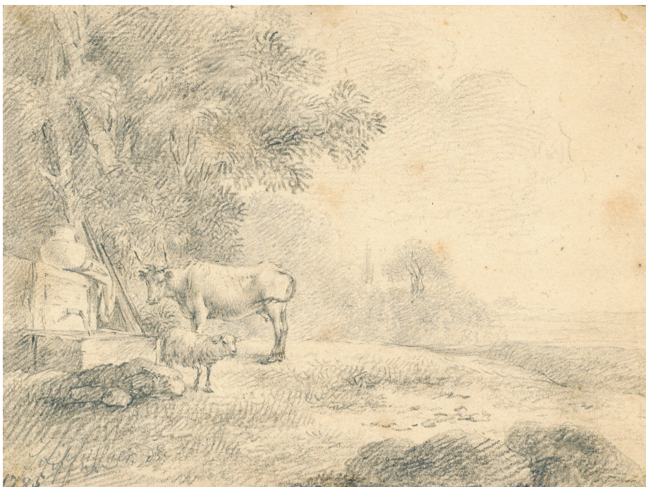
Илл. 5. Г. Шифнер, Этюд с коровой и овцой, I , 1785, бумага, карандаш, частная коллекция в Риге