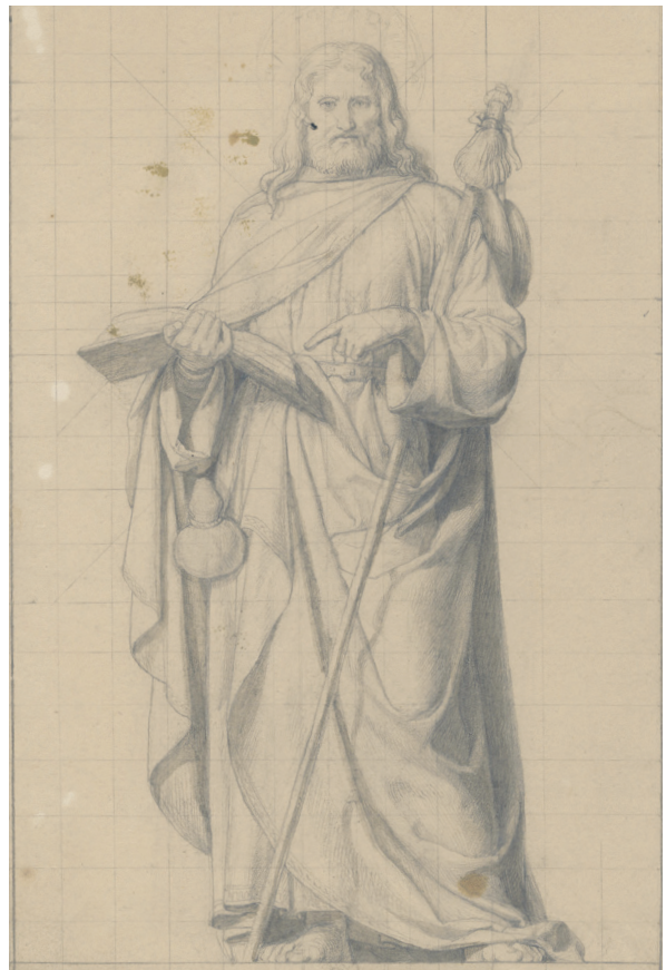
Илл. 9. Ю. Деринг, эскиз для алтарной картины, 1844, возможно, один из следующих вариантов картины для церкви в Мыслово, НБЛ, инв. R IW-1/89–24

После возвращения в Дрезден Деринг впервые получил заказ на выполнение алтарной картины, и 27 ноября 1844 года в реестре было записано: «Св. Иаков, алтарная картина собственного сочинения для церкви в Мыслово, для графини Ржевской; картина (закончена 19 апреля 1845 года) была написана маслом, на золотой грунтовке, размеры – 4 фута 7 дюймов x 3 фута». 11 Некоторое представление об этой картине дает сохранившийся рисунок ( Jacobus Maior , 1844, собрание «Редкие книги и рукописи» в Национальной библиотеке Латвии, Рига, илл. 8, 9).