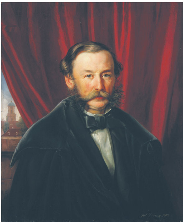
Илл. 2. Ю. Деринг, Портрет графа Вильгельма Рачиньского ( Graf Wilhelm Leopold von Raczynski , 1808–1889), 1862, холст, масло, 77,5 × 64,3 см, Национальный музей в Познани (НМП), инв. FR 645