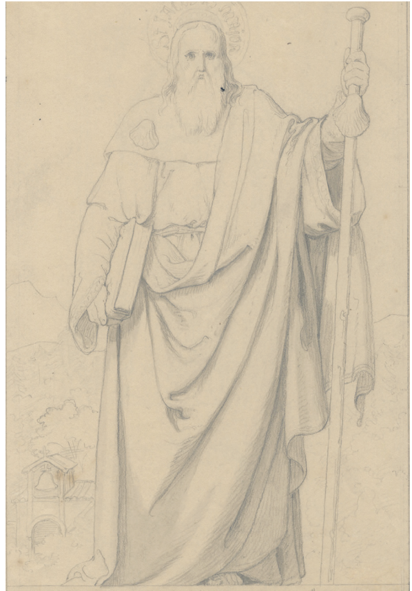
Илл. 8. Ю. Деринг, Апостол Иаков , эскиз для алтарной картины в Мыслово, 1844, НБЛ, инв. R IW-1/89–10

Бнинского. 10 Некоторое представление о профессиональном мастерстве молодого художника дает один из сохранившихся рисунков 1844 года – Женский портрет (илл. 7).