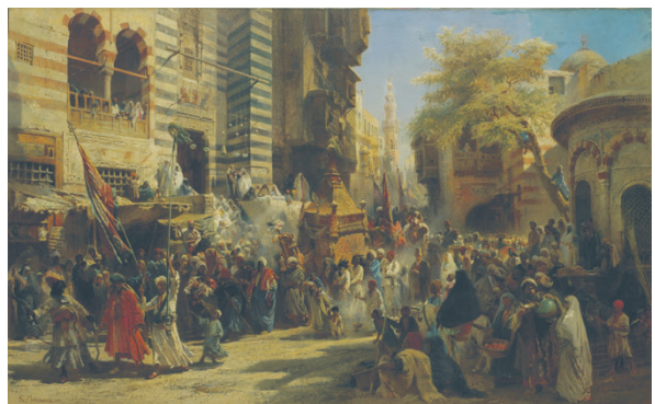
Илл. 5. К. Е. Маковский, Возвращение священного ковра из Мекки в Каир , 1875, холст, масло, 99,5 × 146,5 см, Национальная картинная галерея Армении, Ереван