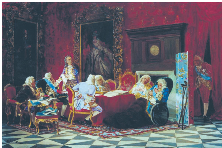
Илл. 8. В. И. Якоби, Артемий Волынский на заседании кабинета министров , 1875, холст, масло, 45 × 68 см, Омский областной музей изобразительных искусств им. М. А. Врубеля