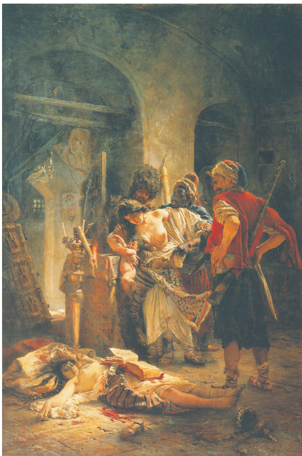
Илл. 6. К. Е. Маковский, Болгарские мученицы , 1877, холст, масло, 207 × 141 см, Национальный художественный музей Республики Беларусь, Минск