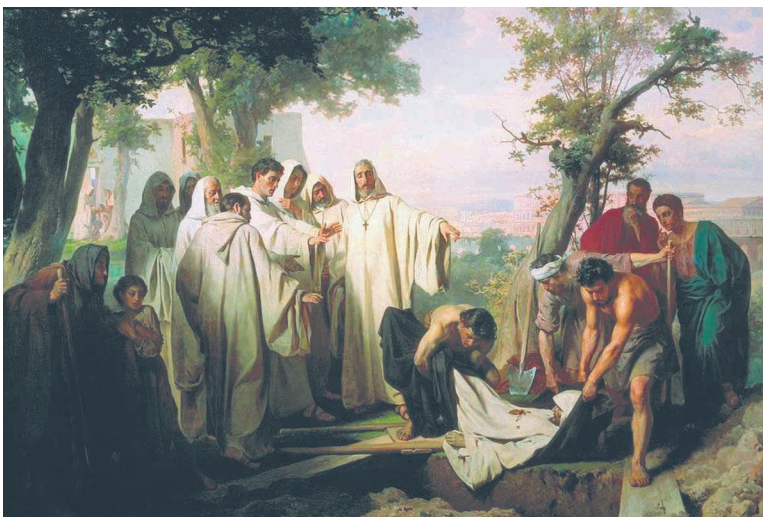
Илл. 2. В. П. Верещагин, Святой Григорий проклинает умершего монаха за нарушение обета бессребрия , 1869, холст, масло, 147,5 × 214 см, Государственный Русский музей (ГРМ), Санкт-Петербург

Значительно более перспективным было другое направление в позднеакадемической живописи, сложившееся под влиянием современного европейского искусства. Важную роль в его формировании на русской почве сыграли ежегодные выставки парижского Салона, пользовавшиеся большой популярностью во всем художественном мире. Тематическое разнообразие показанных там произведений, техническая виртуозность французских мастеров производили большое впечатление на выпускников петербургской Академии художеств, все чаще посещавших Париж. Знакомство с живописью Салона значительно расширяло их творчество в жанрово-тематическом аспекте и разнообразило стилистическую амплитуду искусства этого периода. Тома Кутюр, автор картины Римляне эпохи упадка (1847) и Леон Жером, наиболее полно воплотивший своим творчеством направление «неогрек», оказавший влияние и на развитие ориентализма в искусстве того времени; так называемый стиль трубадур, представленный в Салоне, соединение романтических и реалистических тенденций в исторических полотнах Поля Деляроша вызывали пристальный интерес русских художников. Это эклектичное соединение разных эпох, стран и культур в их стилизованном салонном варианте, казалось, открывает новые художественные горизонты.