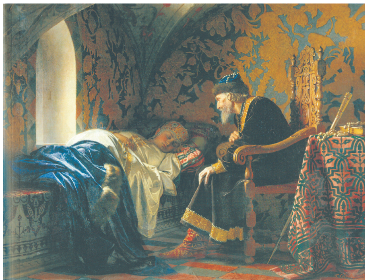
Илл. 9. Г. С. Седов, Царь Иван Грозный любителю на Василису Мелентьеву , 1875, холст, масло, 137 × 172 см, ГРМ

ки. На самом деле, К. Маковский на удивление точно придерживается и буквы, и духа события. Достаточно сравнить его изображения с описаниями из книги Нравы и обычаи египтян в первой половине XIX века (1836) неоднократно бывавшего в Египте английского арабиста Э. У. Лэйна, 19 чтобы убедиться, насколько буквально, почти фотографически, совпадают сделанные ученым и художником зарисовки местной жизни, несмотря на то, что англичанин путешествовал по Египту несколько раньше, чем Маковский. Картины русского живописца могли бы служить великолепными документальными иллюстрациями к книге Лэйна. Экзотика далеких стран для уважающих себя художников академического направления становилась предметом серьезного изучения и постижения в самых разных аспектах.