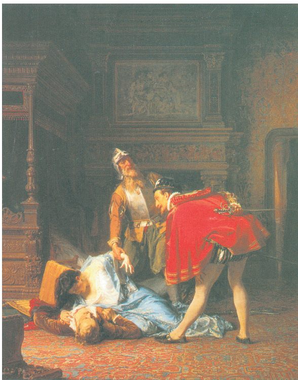
Илл. 7. К. Гун, Сцена из Варфоломеевской ночи , 1870, холст, масло, 142,3 × 113 см, ГТГ