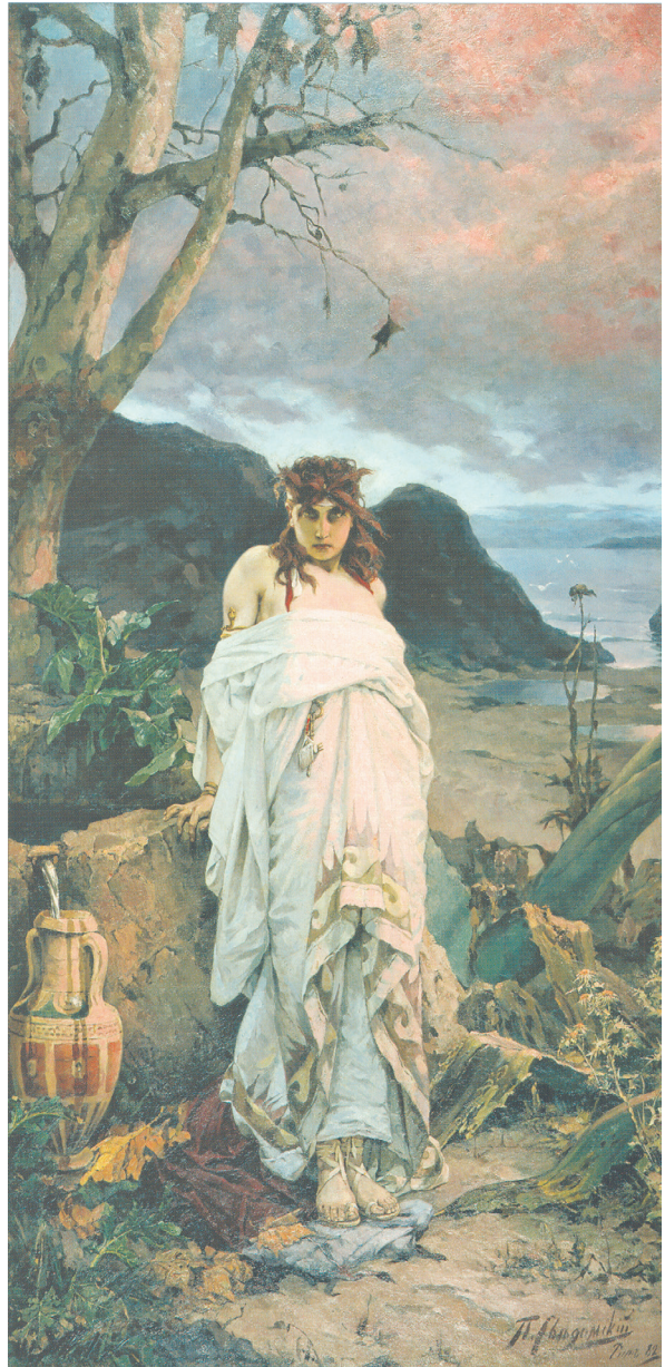
Илл. 4. П. А. Сведомский, Медуза , 1882, холст, масло, 279,2 × 137 см, Государственная Третьяковская галерея (ГТГ), Москва